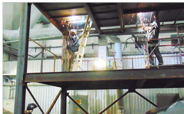
Строится дополнительная линия по производству товарных порошков.