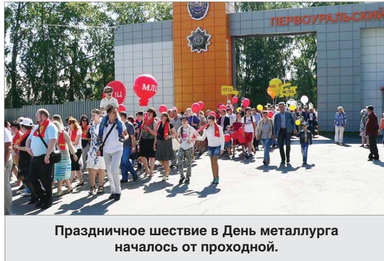
Праздничное шествие в День металлурга началось от проходной.

Запущен в работу после модернизации водогрейный котёл №5 в энергоцехе. Полностью обновлена автоматика. Теперь о том, что горелки требовалось разжигать запальником, и прикладывать усилия к тому, чтобы открыть заслонки, можно забыть.