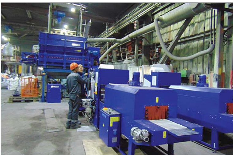
Модернизированная линия лёточных масс выдаёт продукцию.