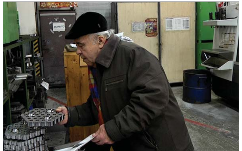
Лицевые для дырчатой насадки теперь делают на современных обрабатывающих центрах.

вано производство обечаек. По дороге заглядываем в термоотдел.