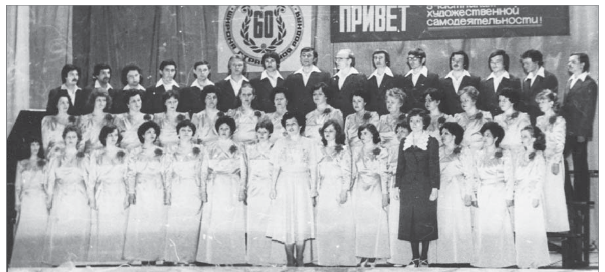
Совместный хор работников ЦЗЛ, ОТК, ПСЛ и цеха КИПиА.