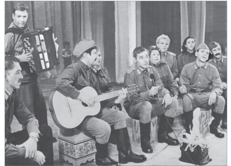
2000 год. Конкурс художественной самодеятельности, посвящённый Великой Победе. Выступают работники центральной лаборатории метрологии.