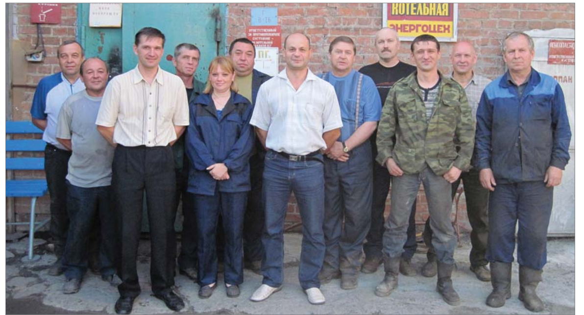
2012 год. Коллектив котельной энергоцеха.

Энергетика включает в себя ещё газо- и водоснабжение. Первая газогенераторная станция была построена на заводе в год его рождения. Топливо — уголь. Вырабатывался газогенераторный газ для обжига огнеупорной продукции в печах первого и второго цехов. Когда протянули газопровод «Бухара — Урал» на завод пришёл природный газ, в 1968 году газификация