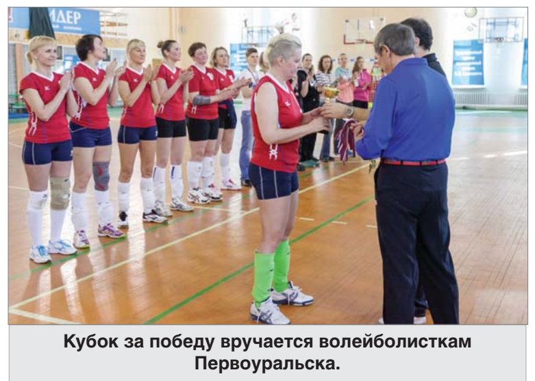
Кубок за победу вручается волейболисткам Первоуральска.