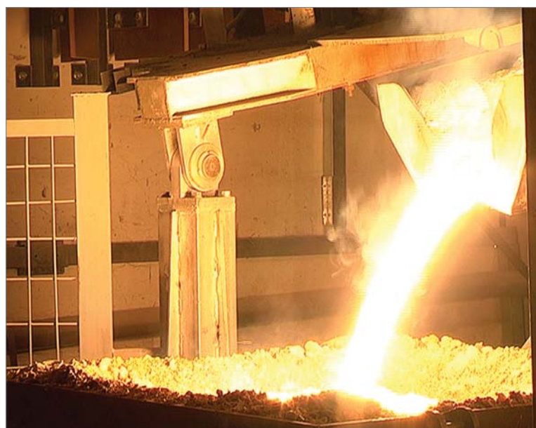
Так выглядит «слив».

дробим, - уточняет он. - Дух перевести некогда. Последняя плавка была — как начали с восьми часов, только полвторого присели. Внимательно следим за качеством, сами настраиваем дробилки и к плавке подходим ответственно.