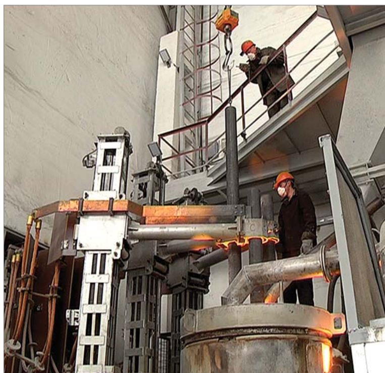
Подготовка печи РКЗ-1 к плавке диоксида циркония, июль 2016 года.