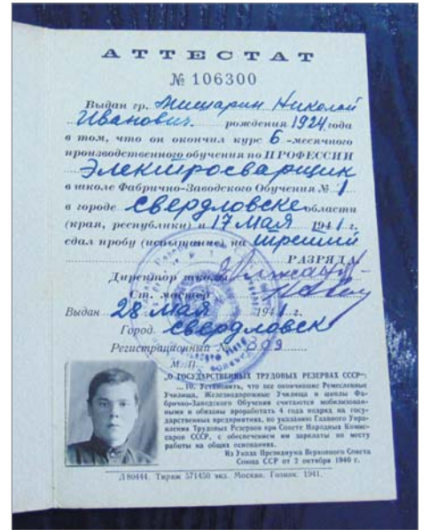
Аттестат школы фабрично-заводского обучения.

одном листе, а потом разрезались на узкие полоски и вклеивались в личное дело каждого. Получалась такая внушительная стопочка разной ширины обрешков на тоненькой кальке, которую подкладывали под копирку. Личная карточка заполнена вручную чернильной ручкой, как и написанная автобиография — единственный документ, подробно рассказывающий о человеке.