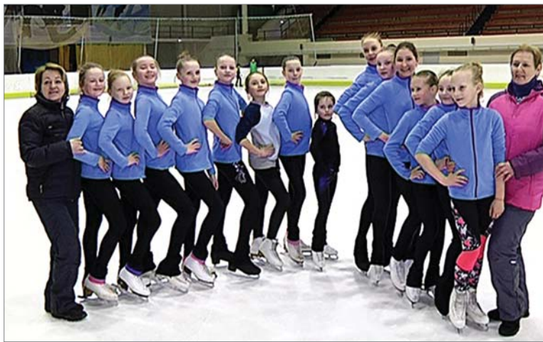
С первоуральского льда - на чемпионат мира.