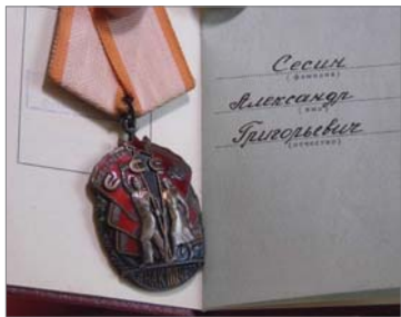
Указ о награждении супруга, обжигальщика орденом «Знак Почёта» подписан 19 февраля 1974-го.