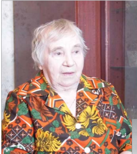
Воспоминания труженицы тыла внуки слушали, как небылицу.

Из мучительных, порой нечеловеческих испытаний военного времени коллектив динасового завода вышел не просто обновлённым. В нём окреп дух, настрой на постоянный поиск в решении производственных задач.