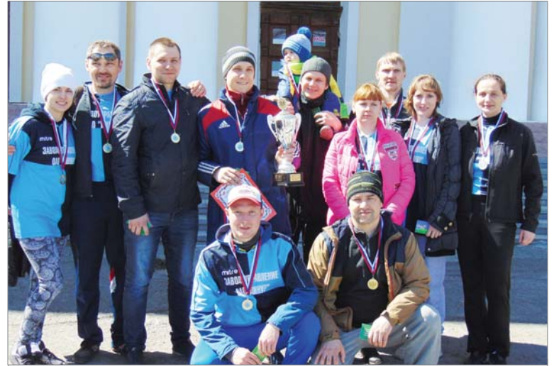
Переходящий Кубок - у команды заводоуправления-победительницы.