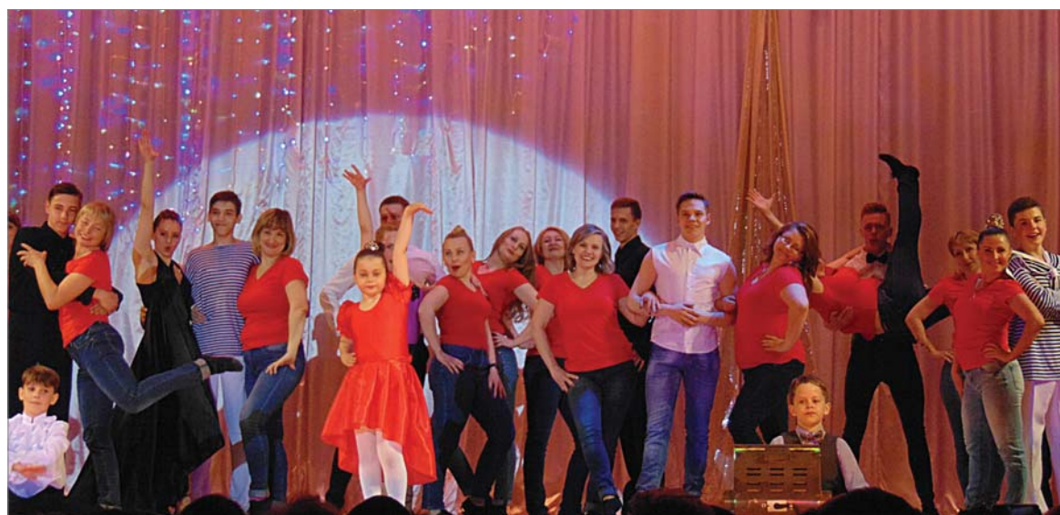
Сюрприз удался! Мама участниц «Фиесты» танцевали с неменьшим удовольствием и задором, чем дети.