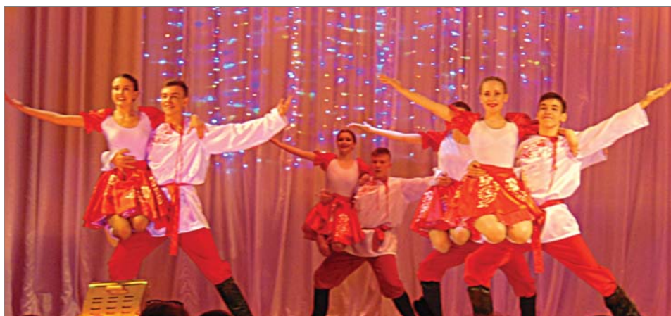
Энергичный «Вася-Василёк» с первых тактов завёл зал, аплодисменты зрителей не стихали.