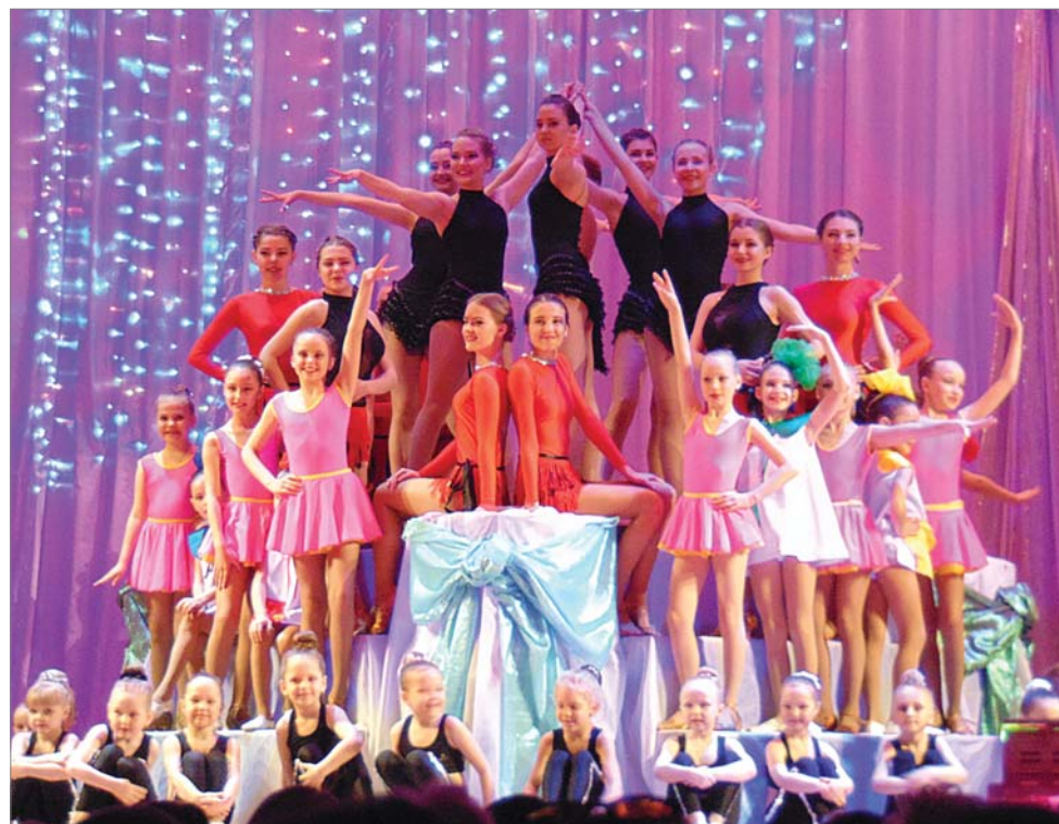
Огромный передвижной торт на сцене, «украшением» которого стали студийцы разных возрастов, усилил акцент на юбилее коллектива.