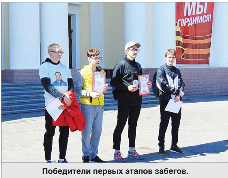
Победители первых этапов забегов.

Репортаж вела Алла ПОТАПОВА