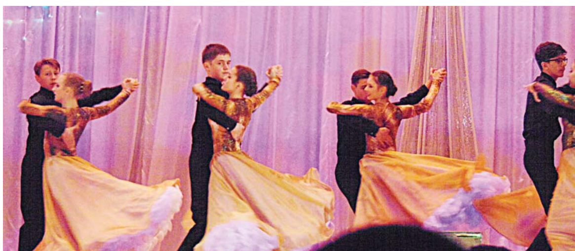
Участники средней группы кружили в танго, классическом и красивом.

Будущие солисты «Фиесты» запустили на сцену «Весёлый паровозик». Непосредственность и артистичность малышек умиляли.