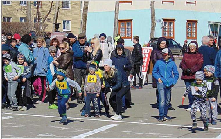
Кто быстрее? Соревнуются дошколята.