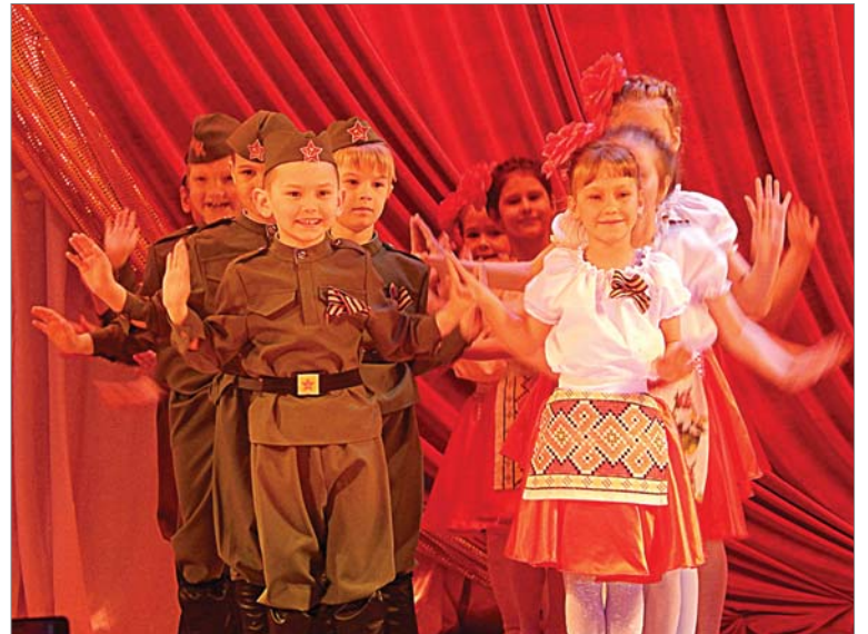
Украшением концерта стало выступление ребятишек из детского сада №27.

не отправили, до окончания Великой Отечественной прослужил в Чебаркуле, а вот потом ему досталось, в Японии. Ранен был.