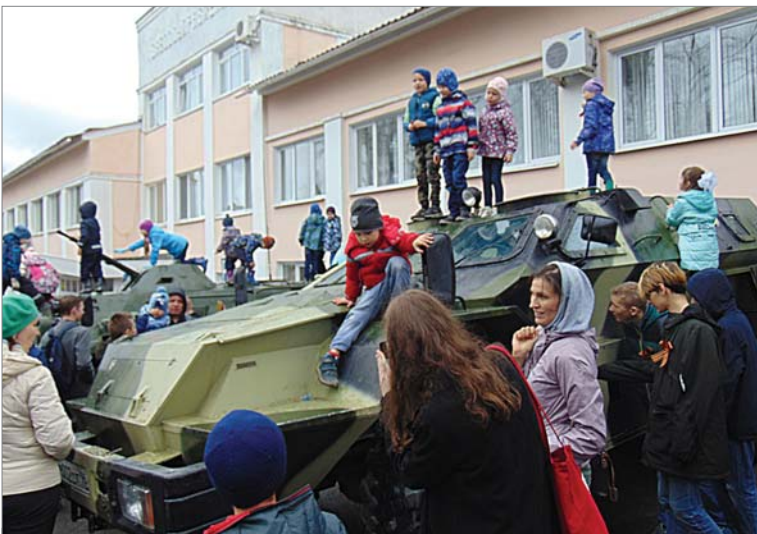
Ребятишкам очень уж хочется вскарабкаться на броню военной техники.

Отгремели праздничные салюты, начались трудовые будни. Так будет всегда. Сколько бы ни прошло лет, 9 Мая останется для нас особенным днём, соединяющим радость от того, что выстояли в той страшной войне и грусть от того, какую цену пришлось заплатить за мир и свободу.