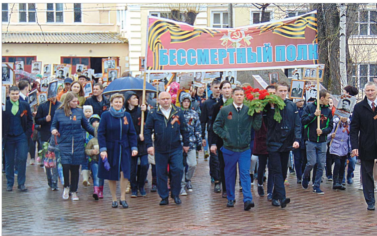
Несмотря на дождь, сотни динасовцев с портретами тех, кому мы обязаны своей мирной жизнью, шли по главной улице микрорайона к Вечному огню.