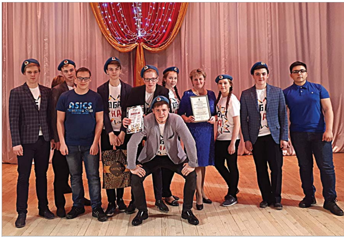
Команда школы №15 на любимом конкурсе динасовцев «А ну-ка, парни!».