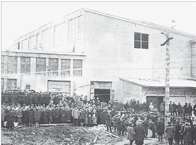
Пуск помольного отделения 1-го цеха (25 мая 1932 год).