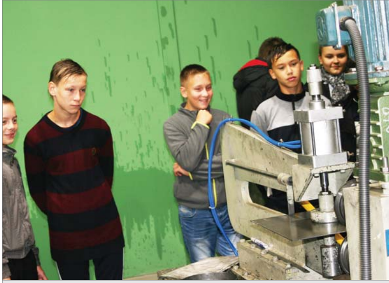
Ребята пятнадцатой - на экскурсии в механолитейном цехе.