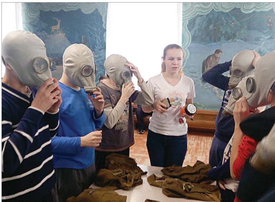
Начальная военная подготовка: проверяем теорию на практике.

В этом году всероссийские проверочные работы стали проводить среди шестых и одиннадцатых классов в качестве апробации. Они введены федеральной службой по надзору в сфере образования и науки. Для проведения контрольных работ разработаны единые задания, общая система оценок. Шестиклассники разных школ писали контрольную работу по разным предметам: русскому языку, математике, географии, биологии. Оценки за выполнение всероссийских проверочных работ не влияют на итоговую отметку обучающихся за год. Результаты позволяют оценить уровень подготовки учащихся, определить направления совершенствования методов и форм обучения.