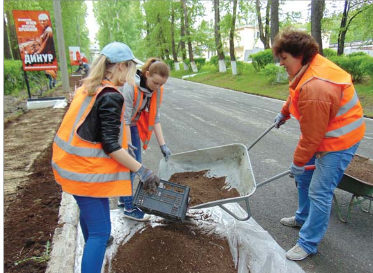
Трудовой десант на «ДИНУРЕ».