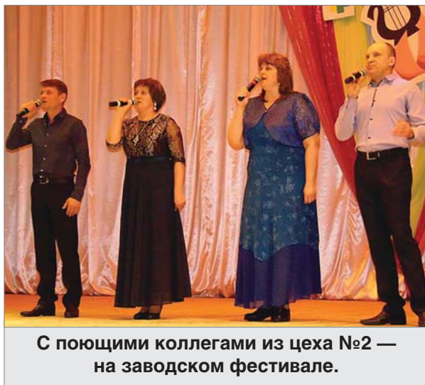
С поющими коллегами из цеха №2 — на заводском фестивале.

- Не знаю, — с улыбкой отвечает собеседник. — Да, бывает, прихожу с работы уставшим, но если надо выступать — значит надо. Иногда и в девять вечера приходилось тренироваться на стадионе. Заметил, после пробежки силы восстанавливаются. Много лет занимаюсь