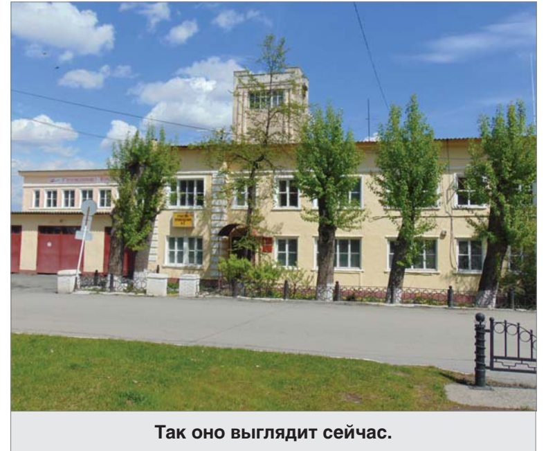
Так оно выглядит сейчас.

можных пожаров. «В 1935 году был построен железнодорожный цех. Завод приобрёл два паровоза. Они ходили по всей линии и по заводской территории. Но пожарные запретили въезд на деревянный склад, и вагоны выкатывали вручную. Под крышей устроили зонт металлический для защиты её от возможного воспламенения паровой искрой. Только после этого стали подавать и вывозить вагоны».