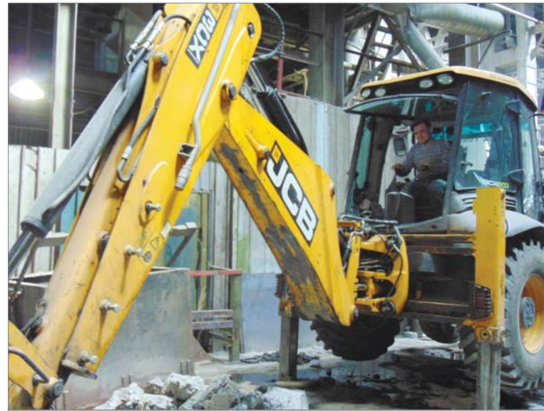
Здесь будет стоять новый фрикционный пресс.

Понемногу ковш экскаватора углубляется. Всего надо выкопать котлован на