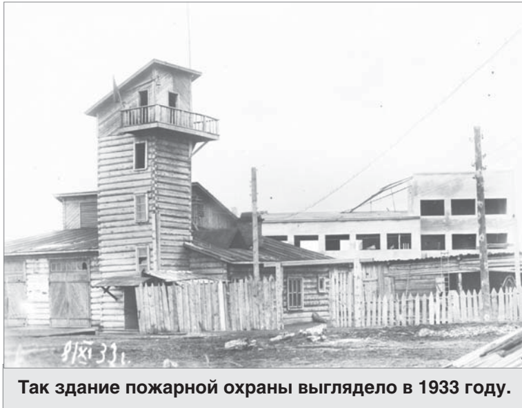
Так здание пожарной охраны выглядело в 1933 году.

В начале тридцатых на берегу Чусовой построили баню. «И потянулись туда промокшие, продрог-