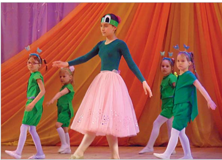
Юркие «кузнечики» студии «Пятнашки».

Пока не начался концерт, дети выплёскивали энергию в состязаниях по прыжкам через скакалку — кто, не сбившись, больше подскочит, крутили обручи, стара-