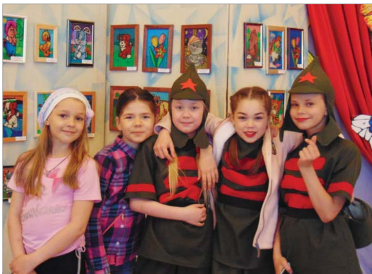
Детство — самая счастливая пора.