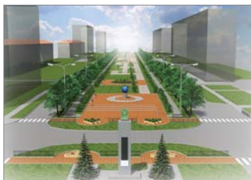
Сквер по улице Мира (г. Асбест).