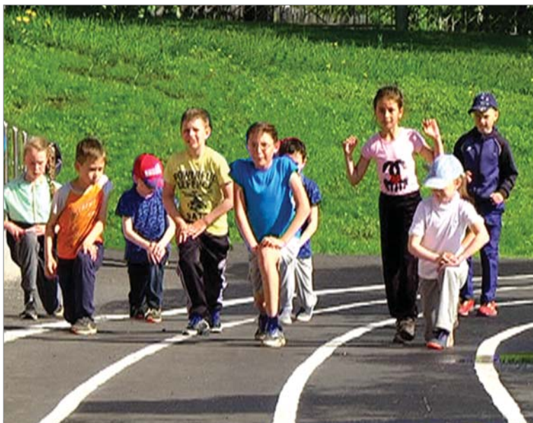
Выпады — обязательный элемент разминки.

Шумные «стайки» за полдня успевают побывать в разных помещениях спорткомплекса. Для активного досуга задействуют бассейн, беговые дорожки, уголок с турниками и лесенками, игровые залы, тир и лыжную базу.