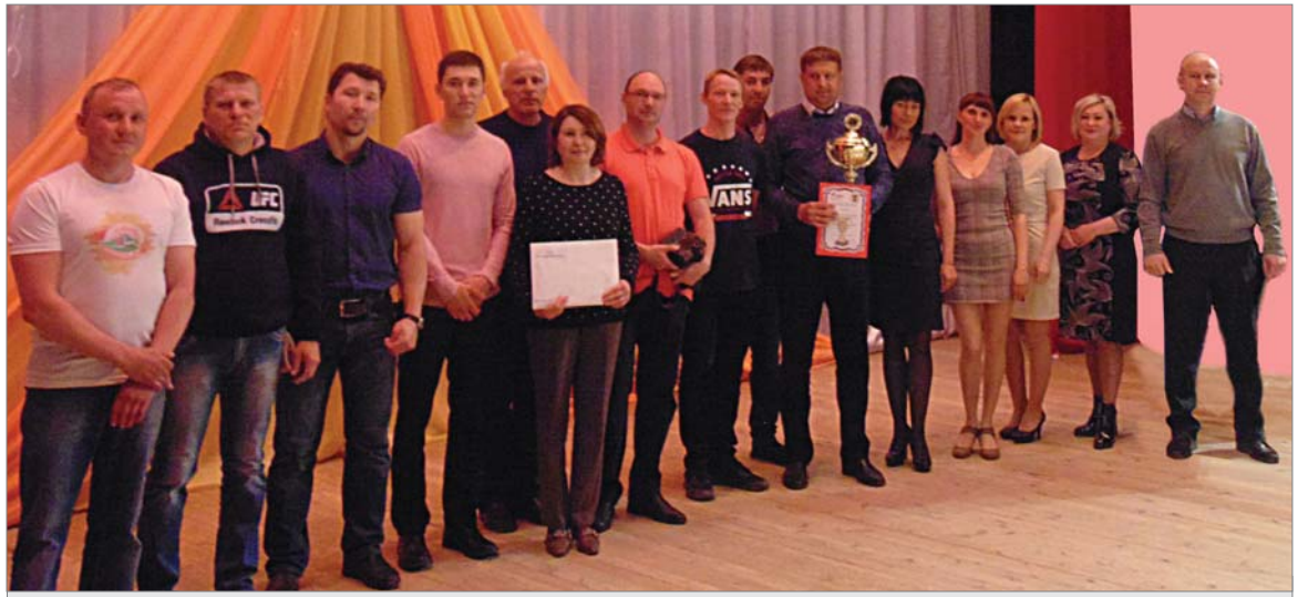
Команда РСУ-энергоцеха и ОТК в четвёртый раз стала победителем Спартакиады во второй группе.