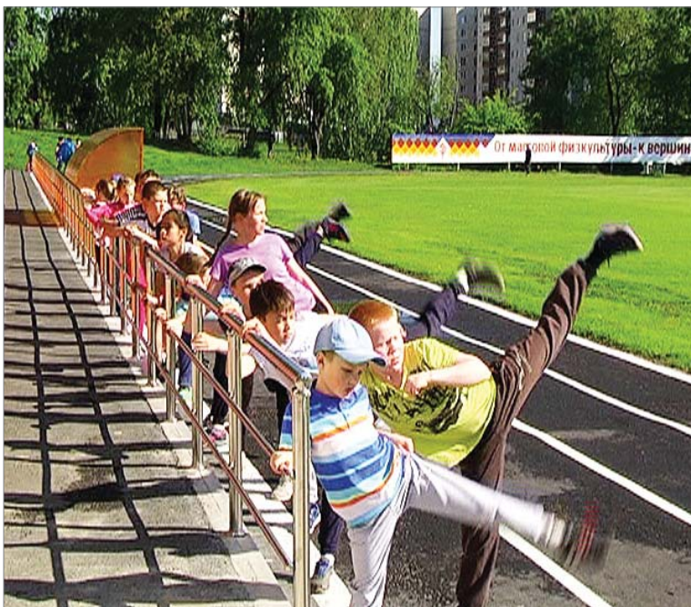
Дружные упражнения на растяжку.