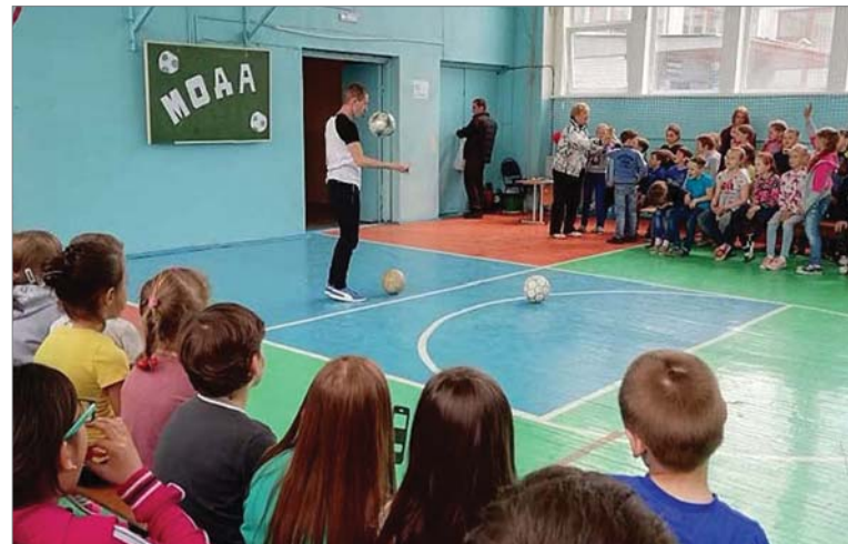
Полосу подготовила Екатерина ТОКАРЕВА.

Школьники, конечно, не упустили возможности сделать фото и взять автограф, чем немало смутили молодого спортсмена.