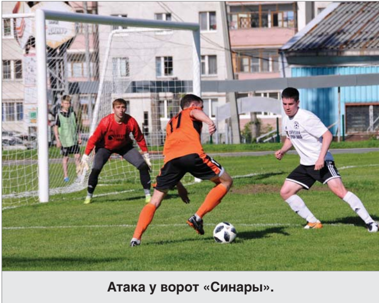
Атака у ворот «Синары».

Игра лидеров сулила немало поводов для радости и волнения. Красивый футбол увидели болельщики в этот день. «Небо в алмазах» сияло над теми, чьи симпатии — на стороне заводской команды. Практически все полтора часа игрового времени подопечные Евгения Федотова доминировали на поле. К 80-й минуте победное «Гол!!!» выплы-