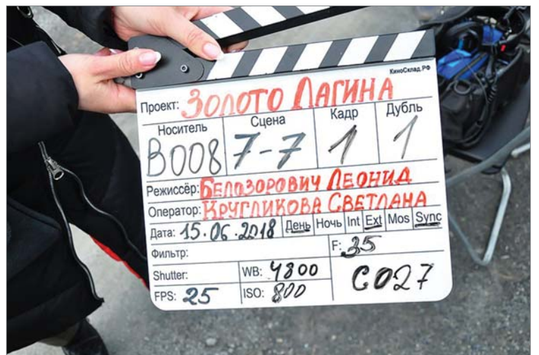
Камера! Мотор! Хлопушка!