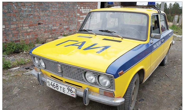
Раритетное авто пригодилось на съёмках.