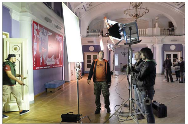
От хорошего освещения в кадре многое зависит.