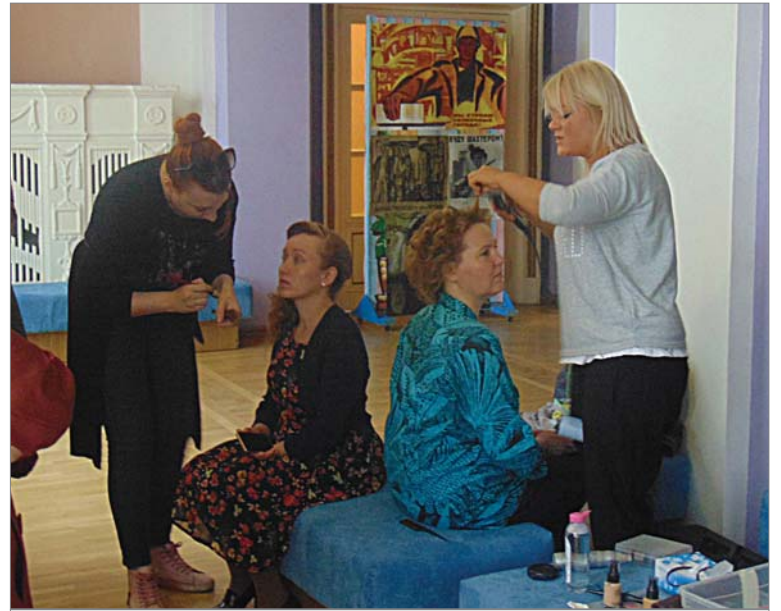
Причёска, грим, костюм - в стиле 80-х.

Короткий разговор с известным актёром открыл перспективу, которая обрадует динасовских поклонников Александра Балуева. На начало августа запланирована творческая встреча, которую, если позволит график съёмки, проведёт Александр Николаевич со зрителями.