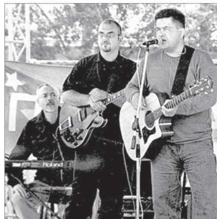
«Давай за!» - в исполнении группы «Любэ» звучала на стадионе в 2002-м.

Поздравляла динасовцев с профессиональным праздником в 2005 году группа «Доктор Ватсон», в следующие годы к нам при-