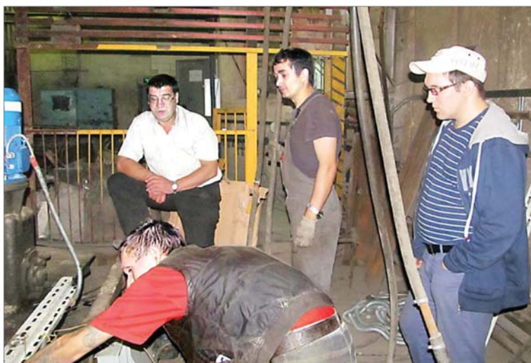
Важная работа по автоматизации контроля за управлением процессом плавки в печи литейного участка МЛЦ требует всеобщего внимания. Август 2013 года.

Завершение лета 2013 года стало важной вехой