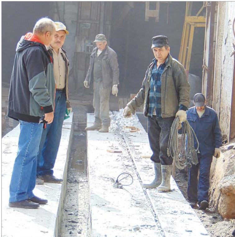
Подрядчики готовят фундамент под рельсы для туннельных вагонов.

Бригада «Базиса», завершив все дела на прессоформовочном участке второго цеха, перешла в первый и приступила к сооружению фундамента под рельсы, по которым изготовленная на прессах продукция на вагонах будет отправляться в сушилку и печь. Бетонная основа высокая,