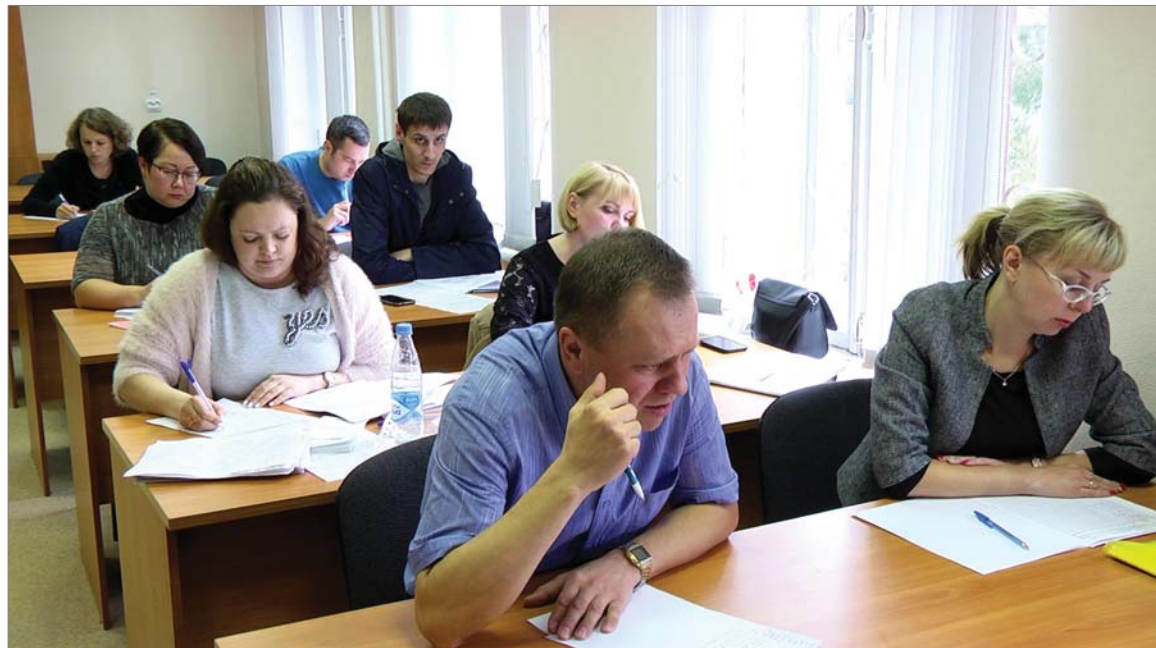
На аттестации по знанию системы менеджмента качества.

- Стало традицией проведение экскурсий на наше предприятие учащихся городских школ. График на четвертый квартал составлен. Наша задача — не только заинтересовать ребят, показать, что такое огнеупорное производство и где наша продукция используется, но и рассказать о перспективах карьерного роста, социальной политике предприятия.