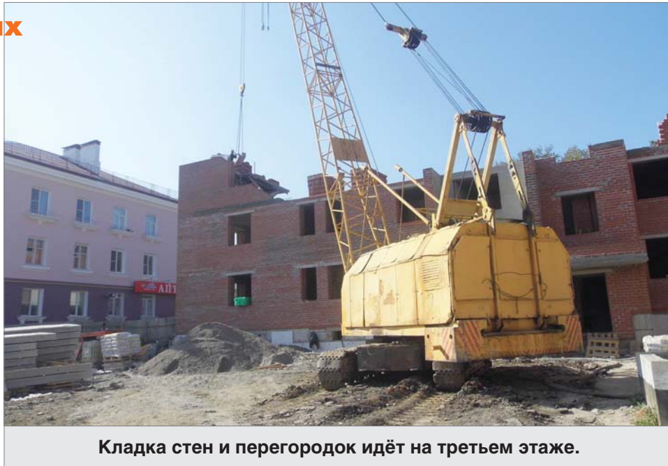
Кладка стен и перегородок идёт на третьем этаже.

Захожу в трёхкомнатную квартиру. Планировка удобная, даже есть небольшое помещение, в котором вполне можно разместить гардеробную. Балконный проём оштукатурен, готов к остеклению.