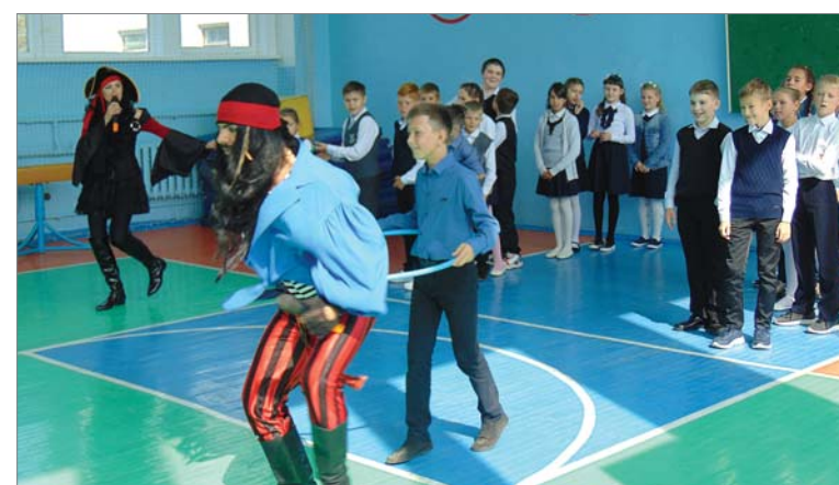
Ребята с удовольствием играли, участвовали в конкурсах.