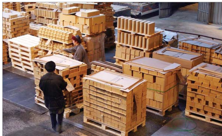
В сентябре-2007 коллектив «ДИНУРА» выполнил заказ для Здешовице.

Сентябрь-2007 — тоже важная «экспортная» веха. Выполнен заказ для Здешовице. Это уже пятая батарея, которую польские коксохимики строят из ди-