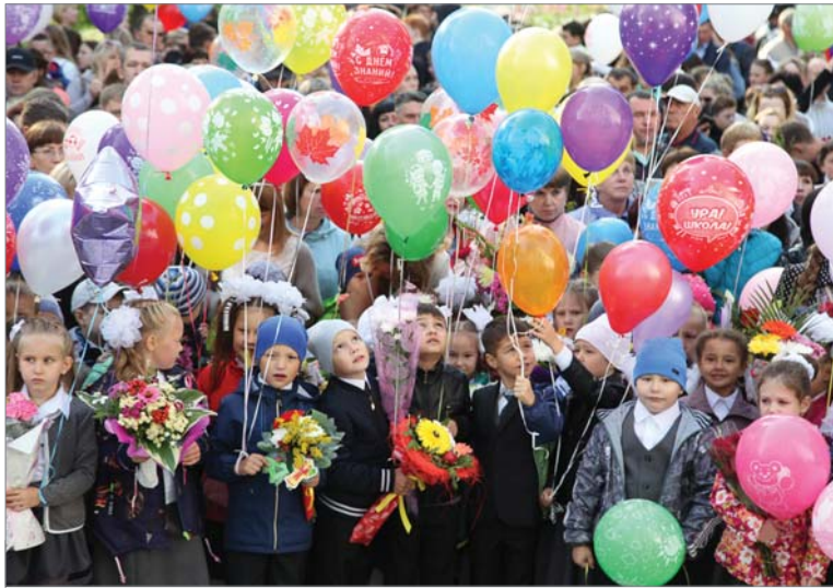
Первоклашки — главные герои торжества.

От имени депутатов городской Думы детей и взрослых с Днём зна-