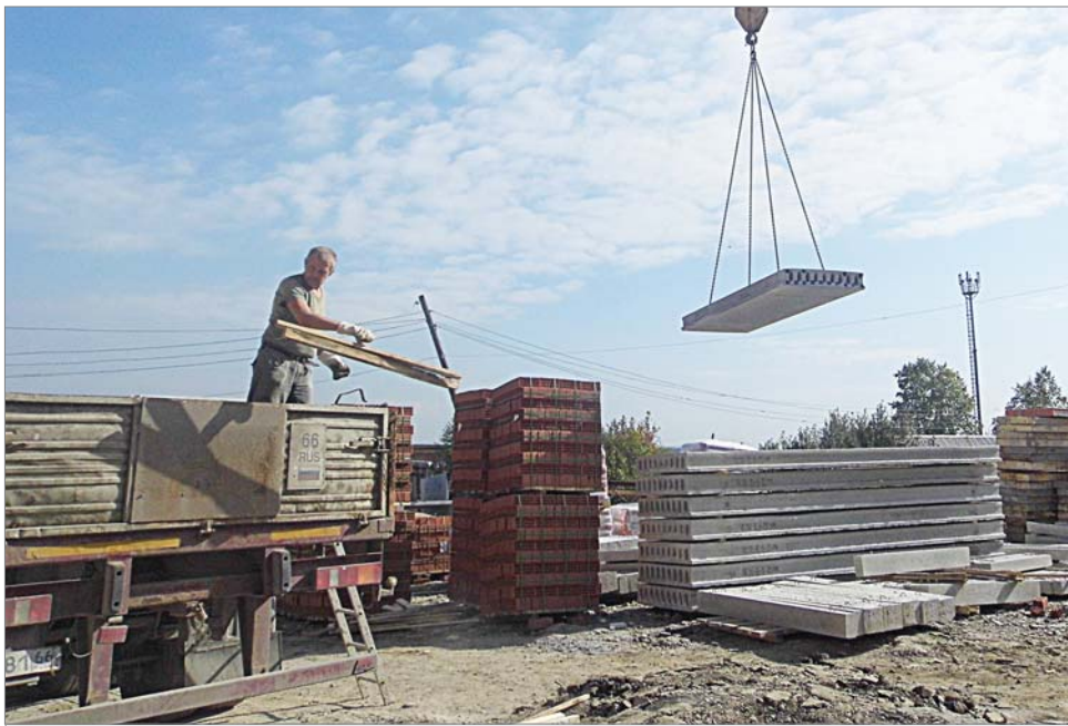
Привезли плиты перекрытий.