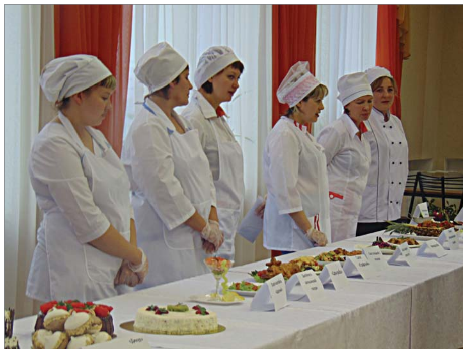
Фантазия и мастерство конкурсанток безгранично.