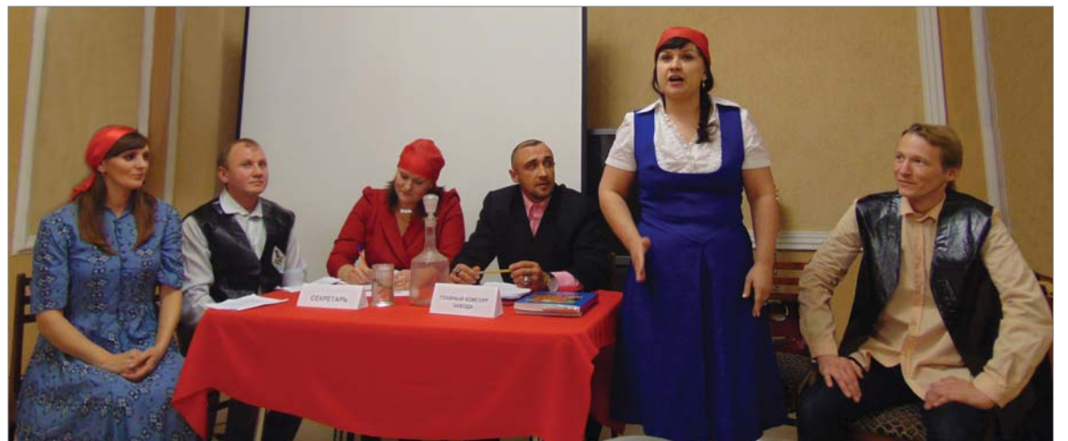
Сценку из комсомольской жизни показывают молодые заводчане.