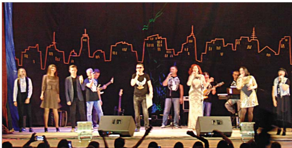
Финальная песня объединила всех.

Автор материалов и фото Екатерина ТОКАРЕВА