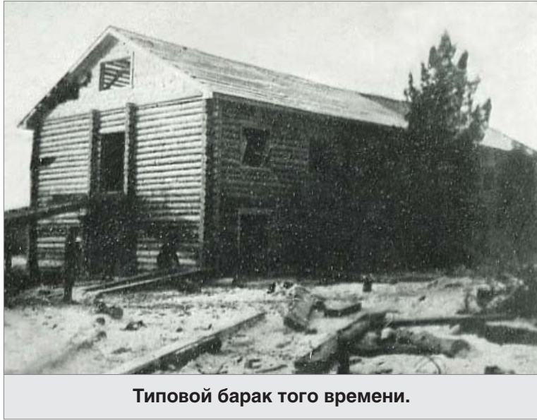
Типовой барак того времени.