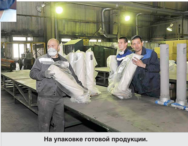
На упаковке готовой продукции.

ноябрь, например, четыре вида трубы, восемнадцать типоразмеров погружных стаканов, шесть марок дозаторов, карбидокремневый тигель, четырнадцатый стопор и четыре типоразмера стопоров-моноблоков. Нашу продукцию ждут в Липецке, Магнитогорске, немного делаем в этом месяце для Новотрубного завода, Нижнего Тагила, готовим пилотную партию в Белоруссию.