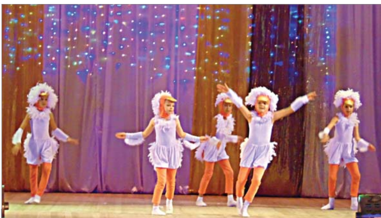
На сцене - «Диско Дак» от «Пятнашек».