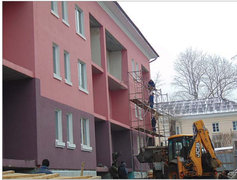
Фасад готов. Строители разбирают леса.

До конца недели форсируются работы по планировке придомовой территории. Проложены бордюры вдоль будущих дороги и тротуаров, размечены газоны, обозначена детская игровая площадка. Понемногу глиняное месиво, которое встречается на любой новостройке, превращается в более-менее приглядный двор. Завезён щебень, которым с помощью техники де-