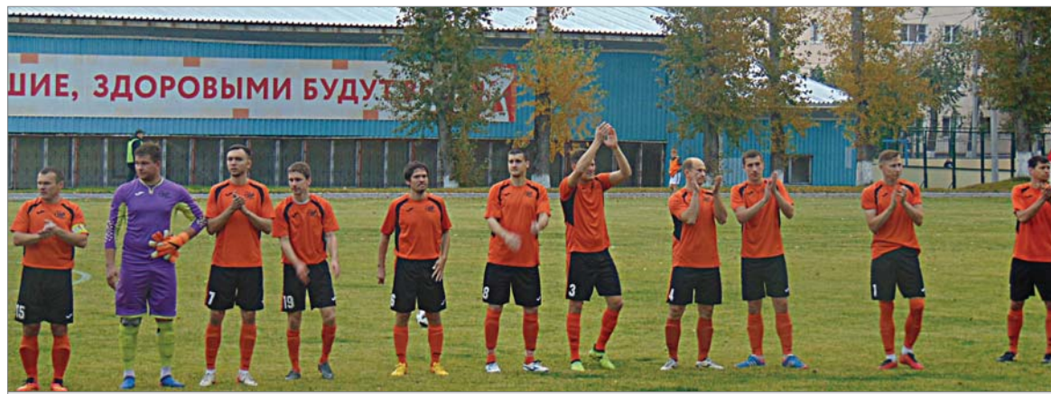
С настроением на победу.