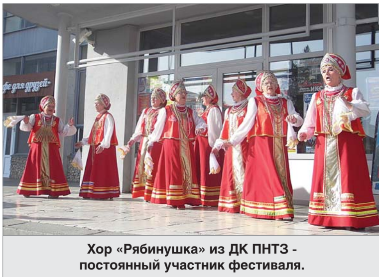
Хор «Рябинушка» из ДК ПНТЗ - постоянный участник фестиваля.

Из знакомых динасовскому зрителю коллективов и исполнителей на фестивале выступили