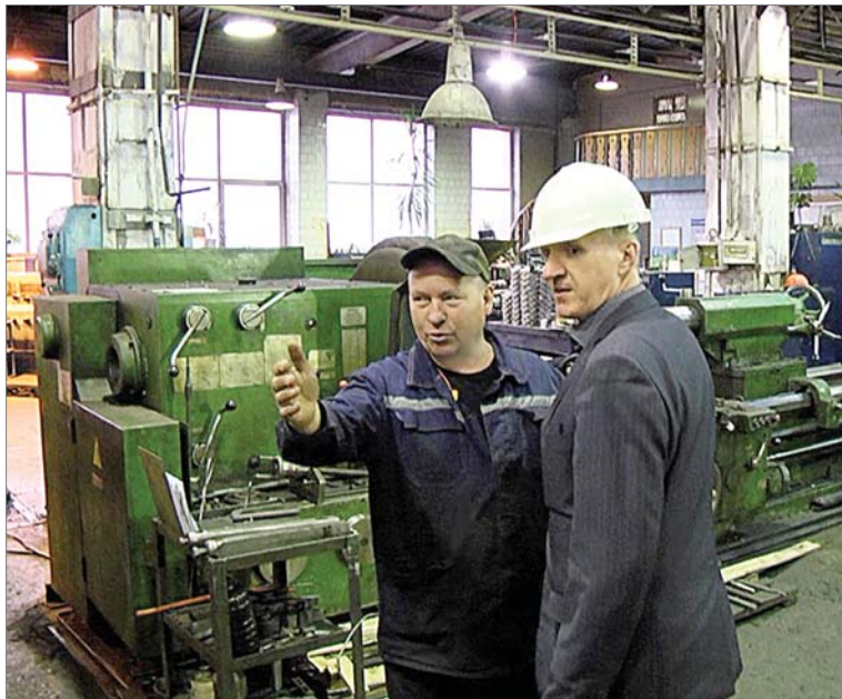
Многие вопросы можно решить с начальником цеха в рабочем порядке.