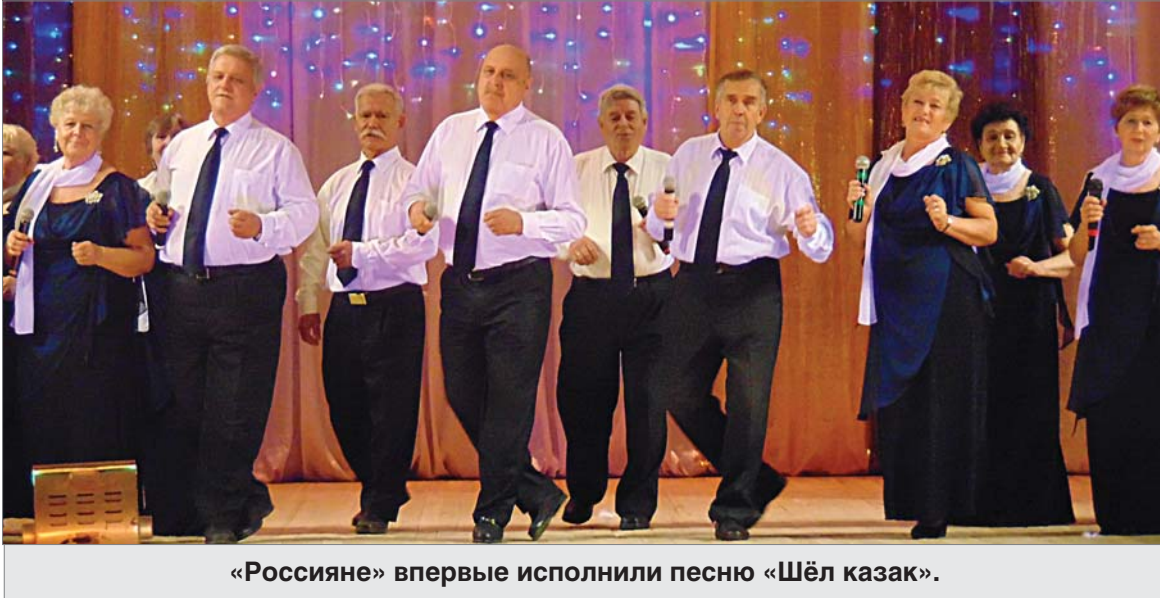
«Россияне» впервые исполнили песню «Шёл казак».

10-й открытый городской фестиваль хоров и ансамблей «Поющий край-2018» собрал без малого 200 участников.