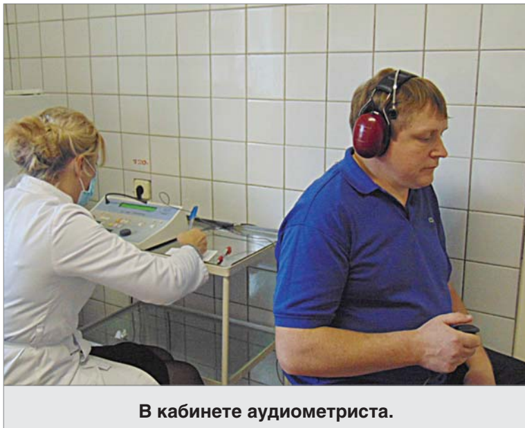
В кабинете аудиометриста.

Был составлен график, по которому работники цехов и служб проходили осмотр. Готовился он так, чтобы не создавать у каби-