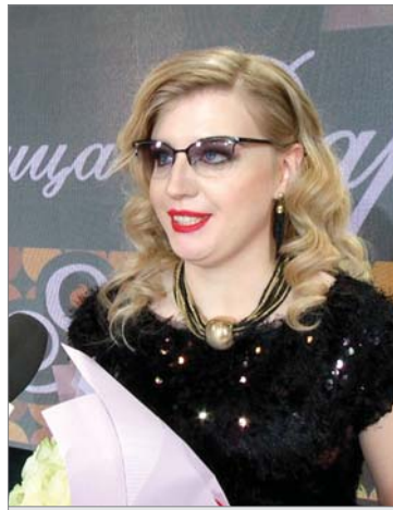
Я благодарна всем!

- Мне очень понравилось. Я получила массу положительных эмоций. Это