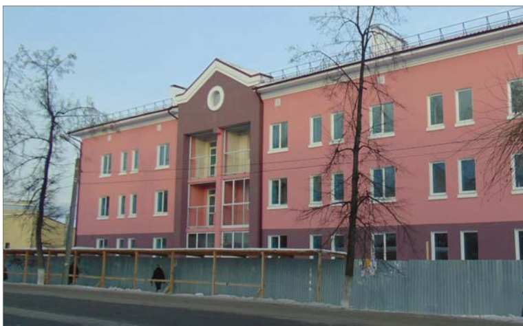
Новоселье не за горами.

Ключевой объект социальной сферы — очередной строящийся дом для заводчан. Эта трёхэтажка на улице Ильича, где работы уже близятся к завершению, - в стиле пятидесятых годов, внешне - копия соседнего дома.