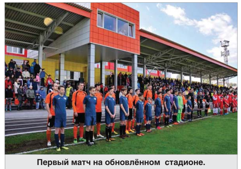
Первый матч на обновлённом стадионе.