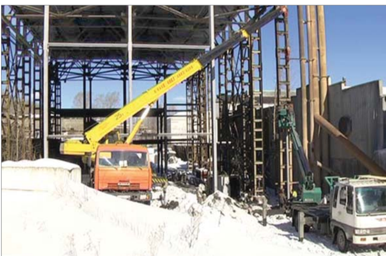
Шаг за шагом подрастала высотная часть участка неформованных огнеупоров.

нено оборудование. Ремонт физкабинета, новое оборудование в здравпункте. Электронной пропускной системой оборудована заводская автопарковка. Стадион стал новым. 895 кресел в трёх секторах, крыша над головами болельщиков, мультимедийный экран у кромки поля - перемены заметны сразу. Тогда же, 26 мая, состоялся первый для «Динура» домашний матч чемпионата области. У «ТрубПром» выиграли 6:3. Комплексный подход проявился в том, что завод провёл масштабную работу по благоустройству: расширена дорога к стадиону, идущая параллельно улице 50-летия СССР, заасфальтирована автостоянка, восстановлен тротуар к зданию младшей школы №15. На радость детям и родителям оборудована детская площадка. Продолжение внимания к соцсфере — начатый в уходящем году капитальный ремонт в профилактории.