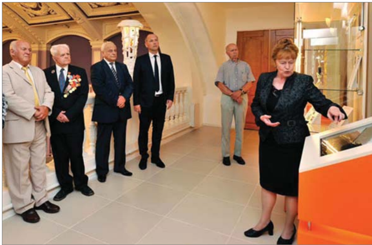
Время великих испытаний отражено в современной экспозиции.

После кропотливой работы, проведённой по решению Совета директоров, в заводском музее открылась новая экспозиция «Время великих испытаний», рассказывающая историю «ДИНУРА» с 1992 года.