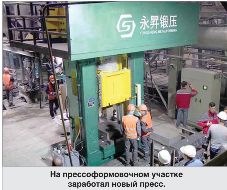
На прессоформовочном участке заработал новый пресс.

В конце года побывали на предприятии представители китайской фирмы «Хаян-групп», где