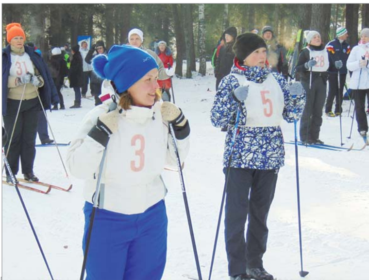
В ожидании старта.