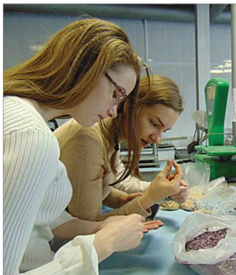
Лицейсты разглядывают хромистый корунд.

школьников — они разглядывали разные образцы корунда, девушки тянулись во весь рост, чтобы увидеть как выглядит шиф, выпол-