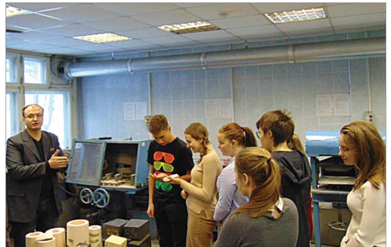
Начало начал в ЦЗЛ, сюда поступают все образцы из цехов.

Старшеклассники познакомились с разными приборами, которыми оснащена заводская лаборатория, узнали, какими характеристиками обладает тот самый образец, полученный при их участии.