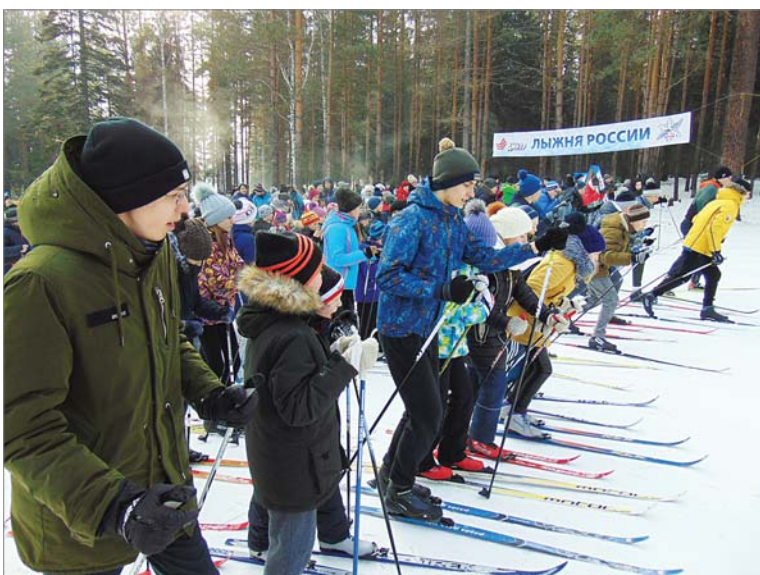
Дружно и массово поддержали динасовцы 36-ю «Лыжню России».

и любители лыжных прогулок, которым всегда в удовольствие и прогуляться по зимнему лесу, и коллектив своего цеха поддержать.