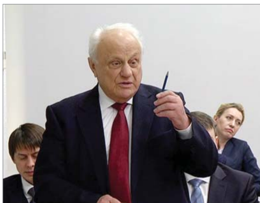
«ДИНУР» получил участок земли и уже закладывает фундамент нового дома.

Также в докладе отмечено, что заметно улучшилось состояние городских дорог: с 2014 года на развитие дорожно-транспортной инфраструктуры Первоуральска направлено более 3 миллиардов рублей. Свыше 330 миллионов рублей выделено на развитие ЖКХ и благоустройство. За это время город стал более ухоженным и светлым. В течение достаточно короткого периода времени Первоуральск вошёл в число инвестиционно привлекательных территорий области. Только за два предыдущих года объём привлечённых инвестиций в основной капитал муниципалитета составил около 5 миллиардов рублей, здесь было создано свыше 2 тысяч новых рабочих мест, не связанных с металлургическим производством. По словам губернатора, своими социальными и экономическими успеха-