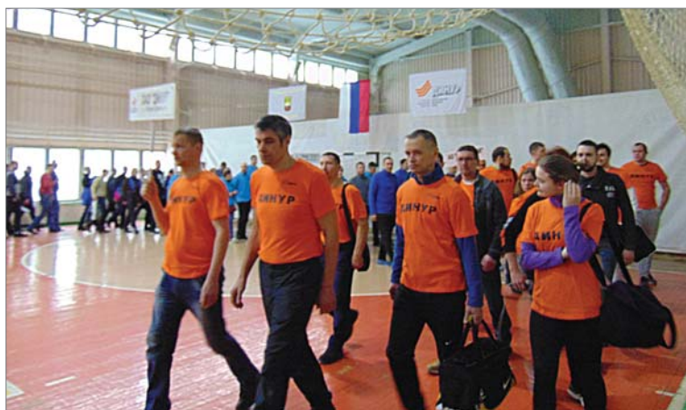
Соревнования открыл парад участников.

- Второй раз используем другой формат — если раньше соревнования по каждому виду спорта проводились отдельно, то с прошлого года стали комбинировать. Удобнее освободить участников команды, готовиться и дружно приезжать. Сегодня — зимние виды, предусмотрен ещё второй этап, по летним.