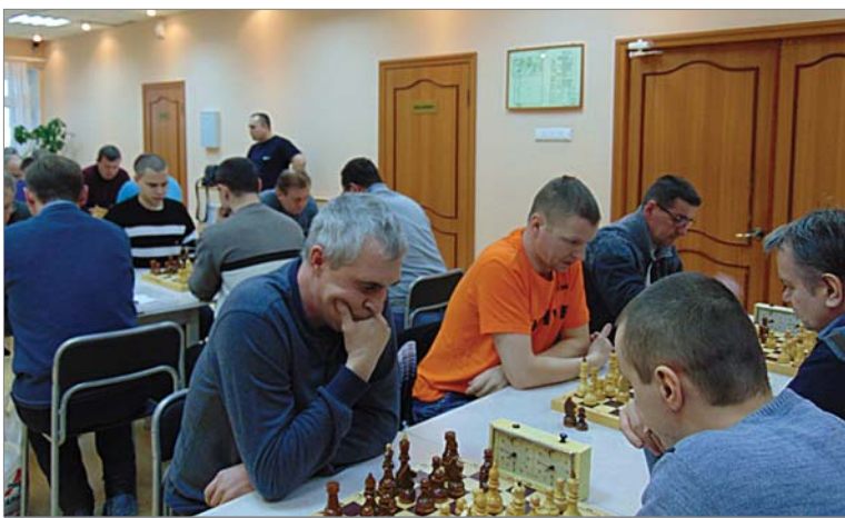
Шахматы любят тишину.