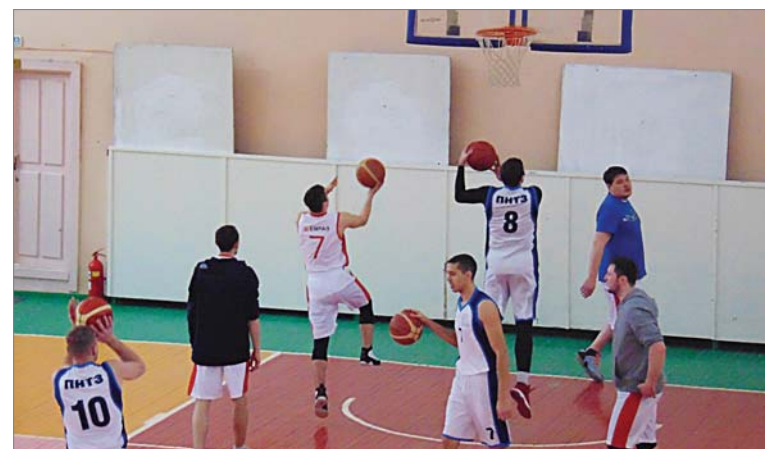
Стритбол — игра энергичная.