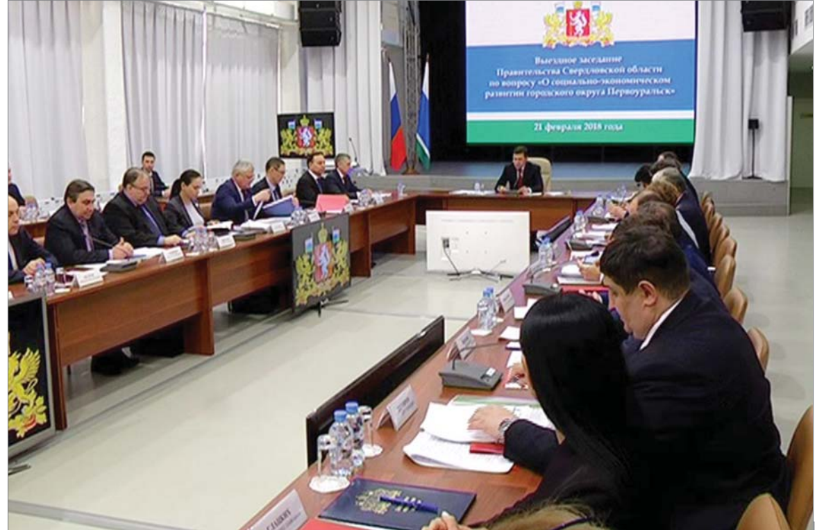
Выездное заседание правительства Свердловской области в ИКЦ.

ми Первоуральск во многом обязан предприятиям города. «Уверен, что программная работа по социально-экономическому развитию Первоуральска должна быть продолжена. Городу есть, куда развиваться, у него есть потенциал для решения новых задач», – заявил Евгений Куйвашев.