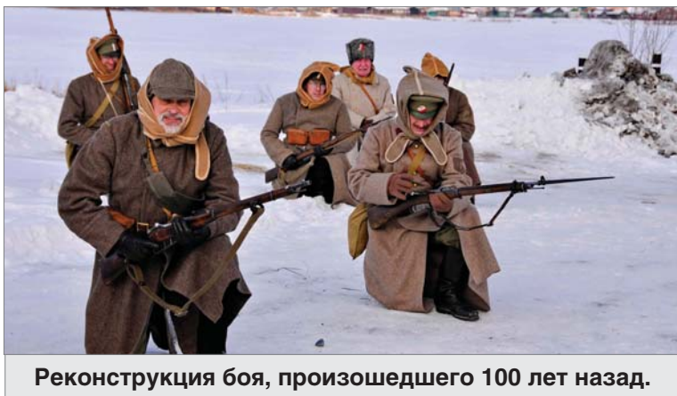
Реконструкция боя, произошедшего 100 лет назад.