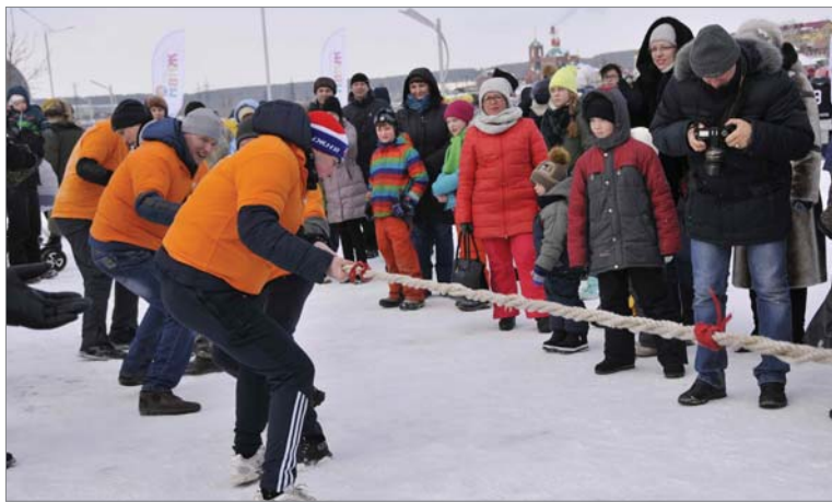
«Раз-два, взяли!» - у сборной «ДИНУРА» «бронза» в перетягивании каната.

Каждая из команд-участниц насчитывала по 5 человек. Всем предстояло быстро и дружно справиться с полосой препятствий, насчитывающей 8 этапов. Метание гранаты в цель, движение по-пластунски, сборка автомата с контрольным выстрелом в воздух, доставка знамени в «штаб», транспортировка раненого товарища на армейской плащ-палатке с «поля боя»... Потребовалось проявить смекалку на этапе разминирования, где нужно было при помощи штык-ножа снять «растяжку» с противопехотной мины.