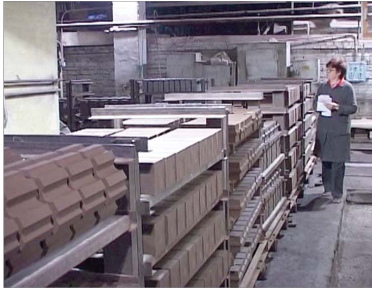
Цех №2. Вагонка - за вагонкой, и уже целый состав сформованных огнеупоров отправляется на обжиговый участок.

Металлургами востребована динуровская неформованная продукция. На УПНО предусмотрены три дополнительных смены для производства лёгочных масс, в каждую необходимо выдавать нагору по 21 тонне в смену плюс по 10 тонн ВГНП. Что касается желобных, то