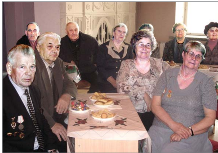
В апреле 2012-го в заводском Дворце состоялась первая встреча детей войны.