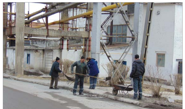
Автор материалов Алла ПОТАПОВА

На территории завода началась уборка. Немного помешал внезапно выпавший снег, но как только он растает, работа продолжится. Заводчане приводят в порядок дороги, тротуары, убирают старую листву, ветки, чистят асфальт от отсева. Всё, что собирается на субботах, оперативно вывозится транспортом АТЦ.