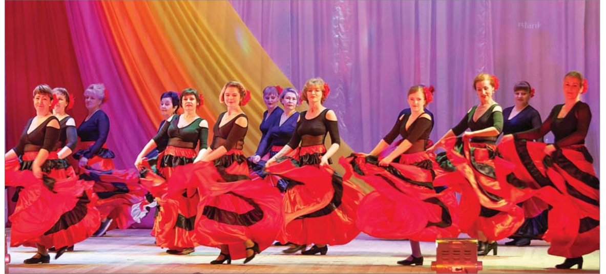
«Под ритмы фламенко» в исполнении танцевальной группы «Ритм».