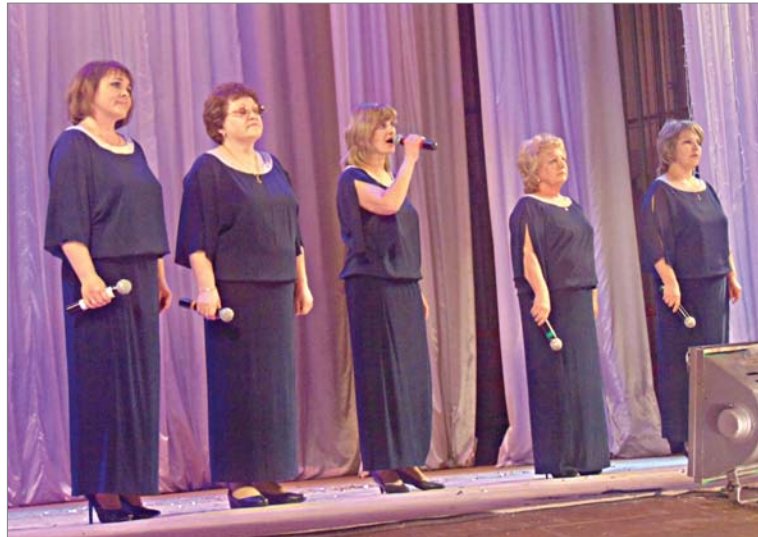
Выступление вокального ансамбля детских садов стало жизнеутверждающим финальным аккордом фестиваля.