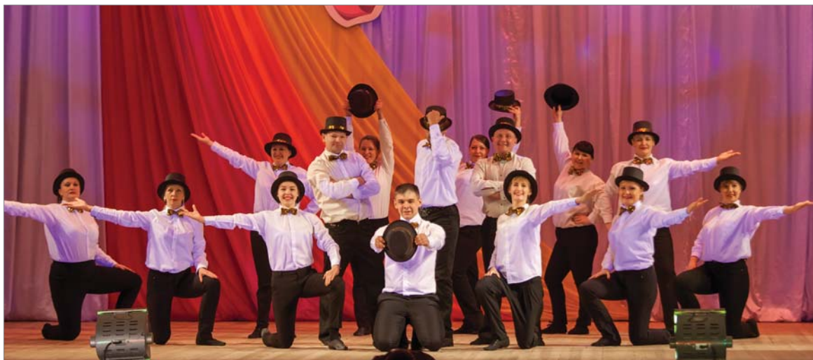
Танцоры Совета молодёжи пригласили зрителей и жюри совершить «Путешествие в Нью-Йорк».

Разные грани своего творчества продемонстрировали танцевальная группа из автотранспортного и железнодорожного