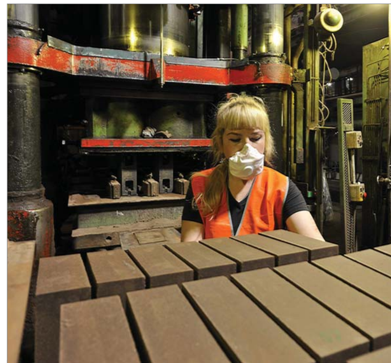
Цех №2. Идёт формовка продукции на «Лайсе».

Обязательство не только по выплате заработной платы, но и увеличению сохраняется. «Мы знаем, как исправить ситуацию. С духом всем собраться! Мобилизоваться! Всё в наших силах», - настроил коллективы исполнительный директор.