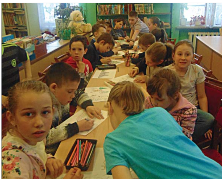
Рисунки мальчишек и девчонок из 4 «е» займут место в школьной библиотеке.