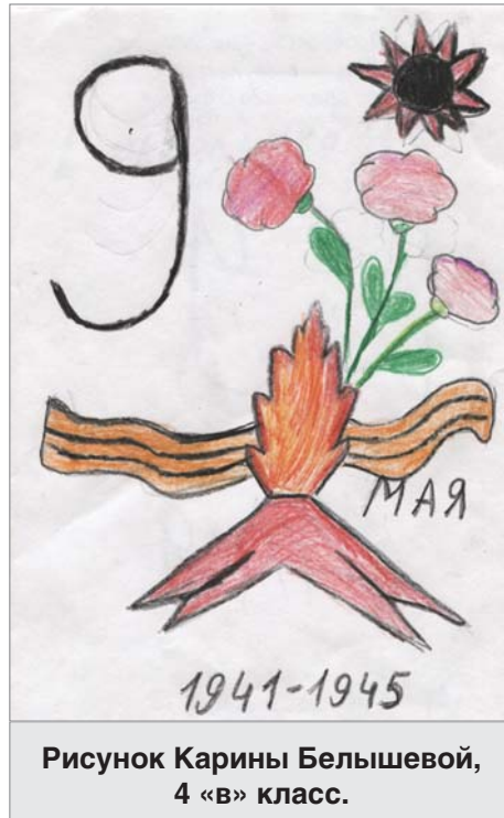
Рисунок Карины Бельшевой, 4 «в» класс.

«Здравствуйте, уважаемые ветераны! Суровые испытания