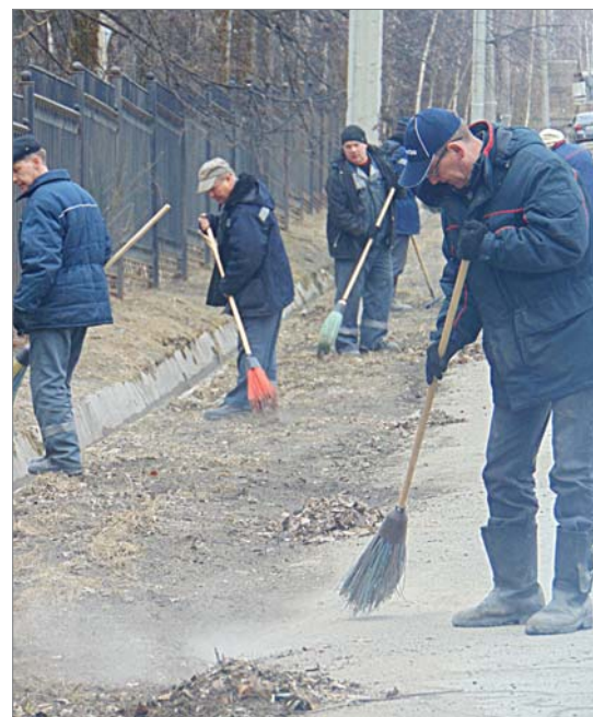
Заводчаны, как всегда, активно наводят порядок на территории предприятия и на закреплённых за их подразделениями улицах Динаса. На этой неделе дружно поработали представители всех цехов и служб. Рудничане, например, убирали улицу Свердлова.