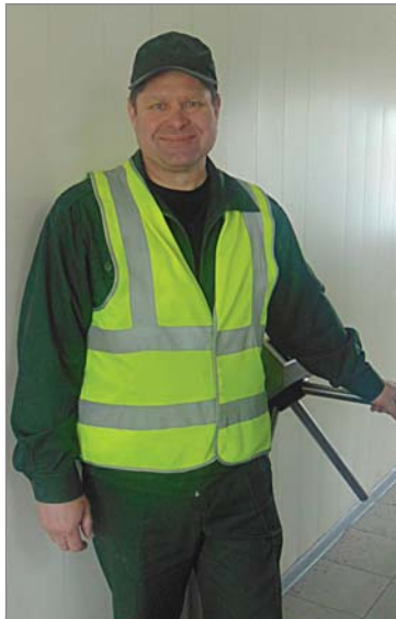
Начинать день с улыбки - золотое правило.