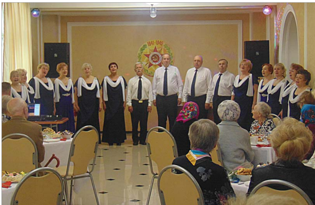
Участники встречи подпевали «Россиянам».