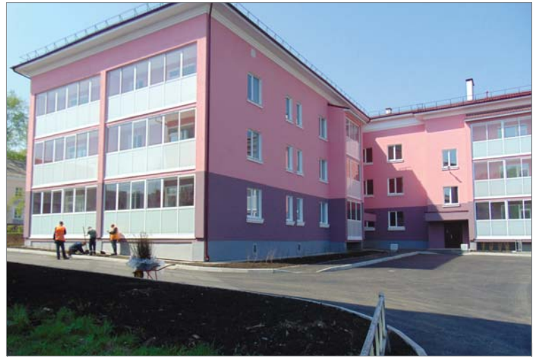
Сегодня по всему видно, новоселья на улице Ильича не за горами.

Большие оконные проёмы, белые обои и под стать им – нежно-серый ламинат делают каждое помещение светлым и уютным. Ещё немного, и