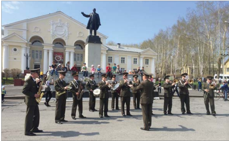
Музыканты военного оркестра задавали торжественный тон.

нимаю, что Победа в Великой Отечественной войне — это история России, а значит, каждого из нас. Нам ещё предстоит учиться, выбирать профессию, служить в армии, и мы — никакие не «Иваны, не помнящие родства». То, что ради мира на Земле, жизнью пожертвовали советские люди, никто из нас не ставит под сомнение. Мы, правнуки Победителей, будем стремиться так же добросовестно работать, заботиться о своих семьях, будем помнить и чтить подвиг советского народа и каждое