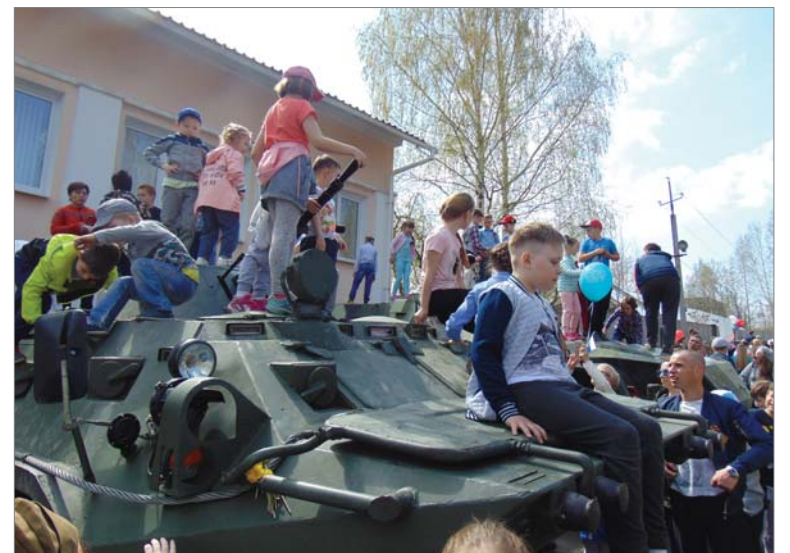
Вскарabкаться на БТР - огромное удовольствие.