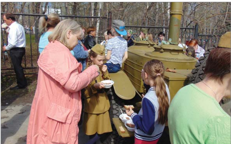
Вкусная каша из полевой кухни.

Заключительным аккордом праздника стал гала-концерт лауреатов и дипломантов заводского фестиваля народного творчества.