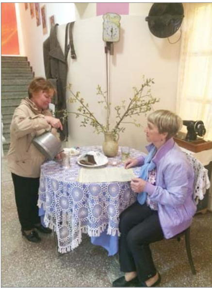
Атмосфера послевоенных лет воссоздана в заводском музее.

ла-концерта заводского фестиваля народного творчества с особым интересом заходили в музей истории предприятия. Воссозданная обстановка послевоенной советской поры манила посидеть за круглым столом с ажурной скатертью, прикоснуться к разным уютным мелочам. Ветераны не раз произносили, оглядевшись: «Как в детстве!», а ребяташки увлечённо рассматривали интерьер.