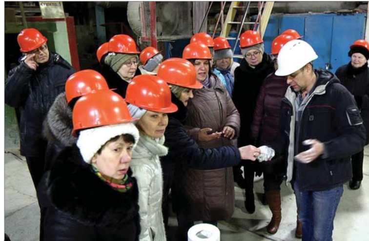
Лучше один раз увидеть. Педагоги Политехникума знакомятся с производством кварцевых изделий.

Для нас знакомство с динасовым заводом оказалось познавательным. Некоторые из коллег-педагогов до экскурсии на «ДИНУР» не знали, что огнеупоры бывают разных видов, считая их обычными «кирпичами». Сегодня встретили в цехе своих выпускников, работают в первом цехе сварщиками, пресовщиками, - преподаватель инженерной гра-