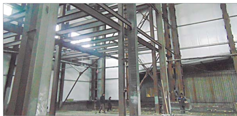
Алла ПОТАПОВА Фото автора

Начальник бюро капитального строительства РСУ Виктор Шальго сказал, что финиш строительных работ близок. Первое полугодие должно стать периодом запуска нового отделения.