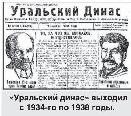
«Уральский динас» выходил с 1934-го по 1938 годы.