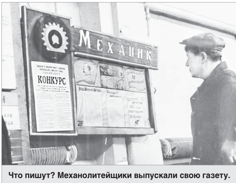
Что пишут? Механолитейщики выпускали свою газету.