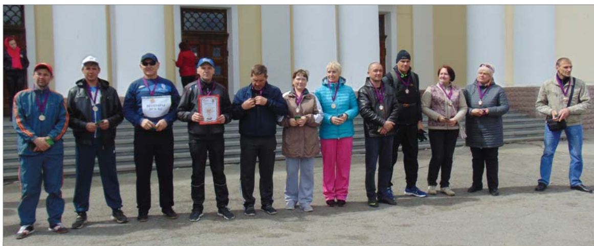
Команда ветеранов цеха №2: «К старту готовы всегда».

Первыми побежали самые маленькие. И тут началось интересное. Кажется, что со своими детьми готовы ринуться на дорожку и родители. Азарт борьбы захватил всех без исключения. Слышны крики: «Руку протягивай! Крепче держи палочку, не урони! Смотри