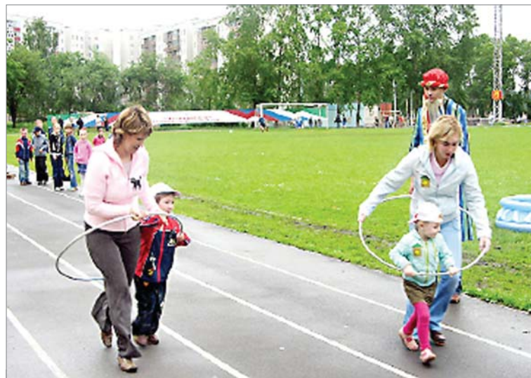
День молодёжи-2007. Эстафета «Спортивный я, спортивная семья».