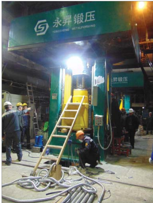
Монтаж китайского прессы в цехе №2 произведён по проекту заводских конструкторов.

тежи по вышеназванным объектам уже отданы специалистам ремонтно-строительного управления для проработки, составления заявок на приобретение материалов.