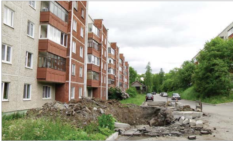
Ремонт теплосетей на улице Свердлова, 6.

Также необходимо отремонтировать 1500 погонных метров межпанельных швов. Площадь кровельных работ составит . – 1280 квадратных метров. Фаса-