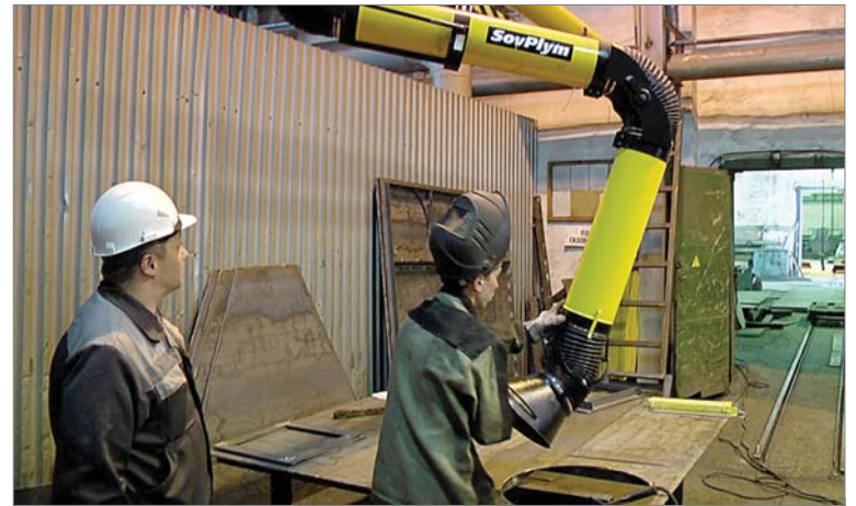
«Рукав» вентиляции сварщик может установить, как ему удобно.

Как правило, всегда оперативно выполняются малозатратные работы по промсанитарии и соблюдению требований охраны труда. Для остальных необходимо больше времени, денег, организационных усилий. Вот свежий пример. В инженерном центре для исключения распространения газов потребовалось изменить режим работы вентиляции в исследовательской лаборатории. Решение было простым и понятным: установить таймер. На оформление заявки, приобретение устройства и его подключение потребовалось два с половиной месяца. Как видите, не всё удаётся сделать быстро.