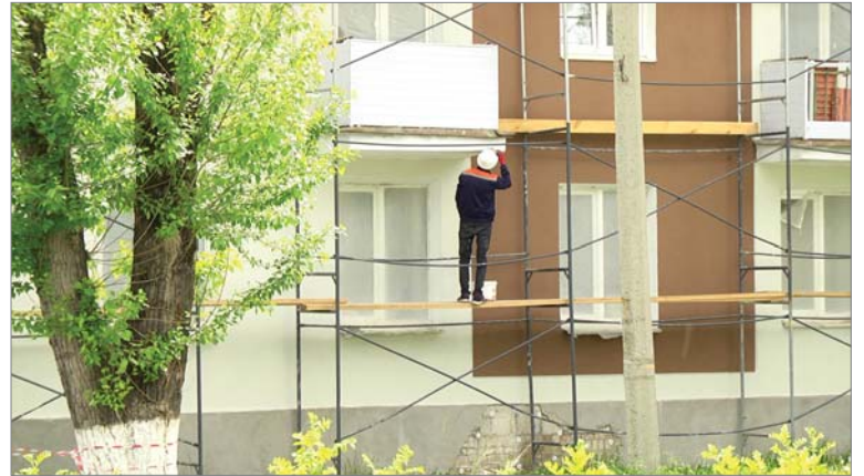
Капремонт дома 24-а, по улице Ильча в самом разгаре.

- К сожалению, нет возможности воздействовать на рекламодателей, которые расклеивают листовки в несанкционированных местах. Несмотря на то, что уборка остановочных