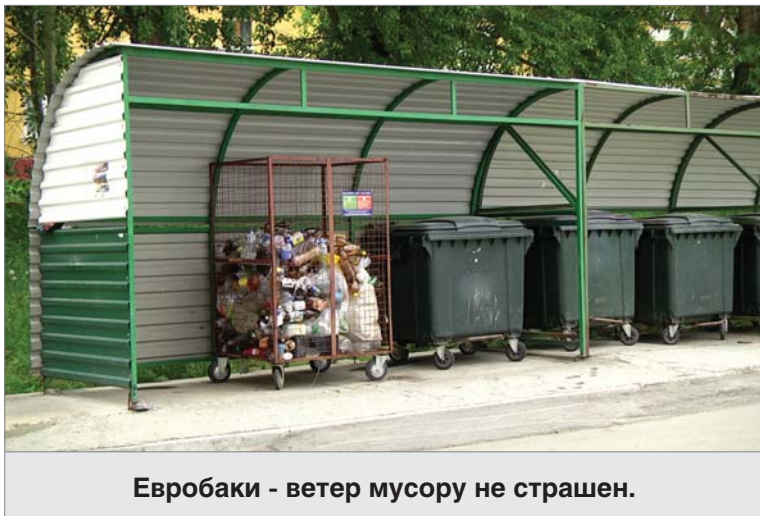
Евробаки - ветер мусору не страшен.

Ежедневно на улицы микрорайона выходят больше двадцати дворников.