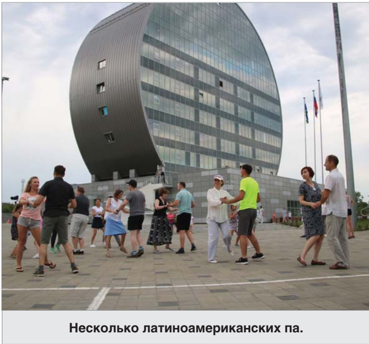
Несколько латиноамериканских па.

Фестиваль «Безумные дни» был задуман и воплощён продюсером Рене Мартеном. В 1995 году он