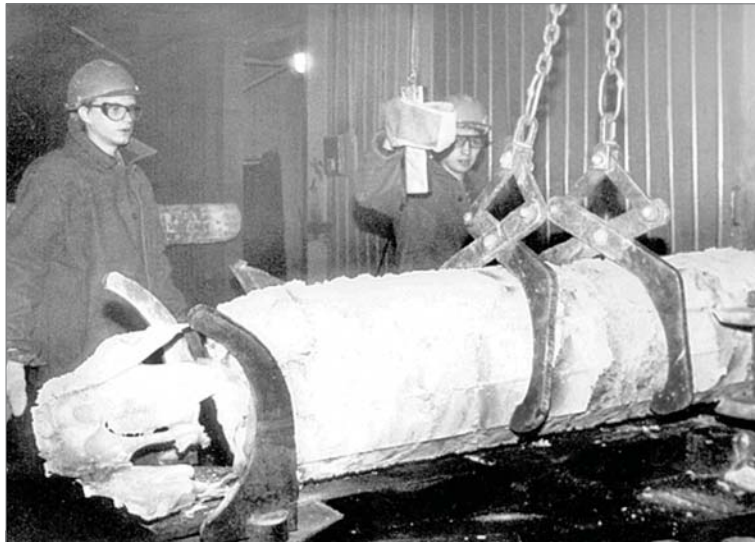
На первом конкурсе плавильщиков кварцевого стекла, 2002 год.

В конце октября 2002-го на заводе состоялся первый конкурс профмастерства среди плавильщиков кварцевого стекла цеха №1.