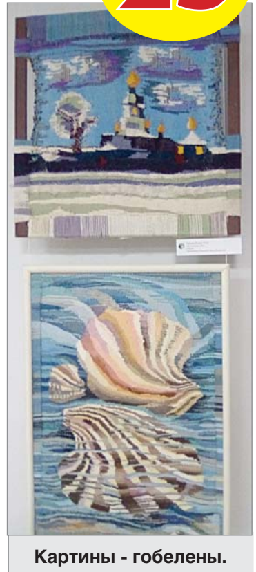
Картины - гобелены.

На полках стеклянного пенала при входе в зал можно долго разглядывать