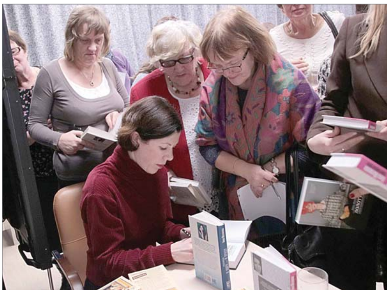
Автограф-сессия писательницы Анны Матвеевой в ИКЦ.