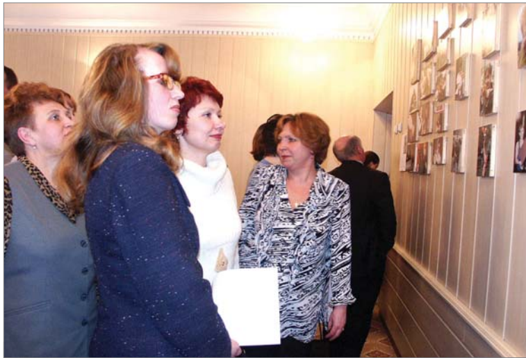
Героями снимков на газетных страницах за десять лет стали многие.