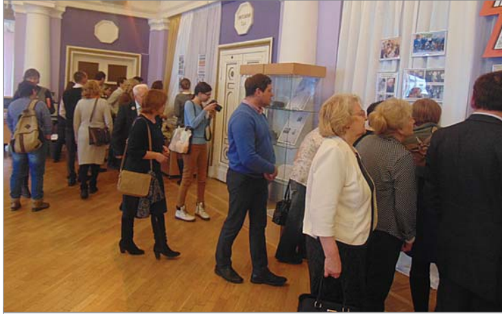
На выставке каждый увидел интересное для себя.