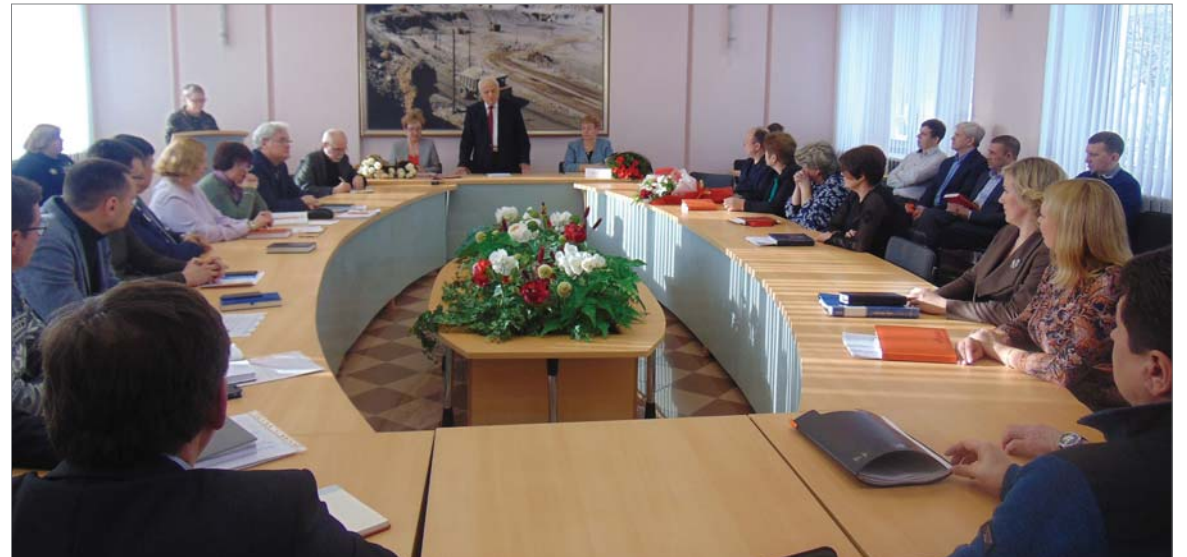
Делаем газету вместе. Наши читатели, собеседники, консультанты.

многопрофильным предприятием и это помогает уверенно чувствовать себя на рынке. Нет массовых сокращений, завод остаётся социально ответственным. Традиции сохраняются и передаются молодому поколению наших тружеников. Нет никаких сомнений в том, что газета и телевидение были и остаются нужны. «Огнеупорщик» - это больше, чем просто информационный ресурс, это хранитель истории, мост между поколениями, воспитатель и пропагандист, хороший собеседник и, порой, организатор. Благодарю коллектив пресс-службы за верность выбранной профессии, за многолетний труд. Желаю, чтобы журналистское любопытство всегда звало в дорогу, душа не черствела, взгляд был объективным. Будем продолжать