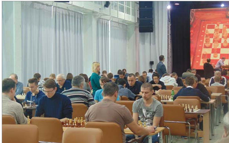
За два дня в ИКЦ сыграли более двухсот шахматистов.