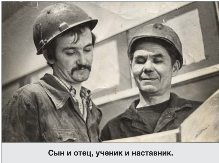
Сын и отец, ученик и наставник.