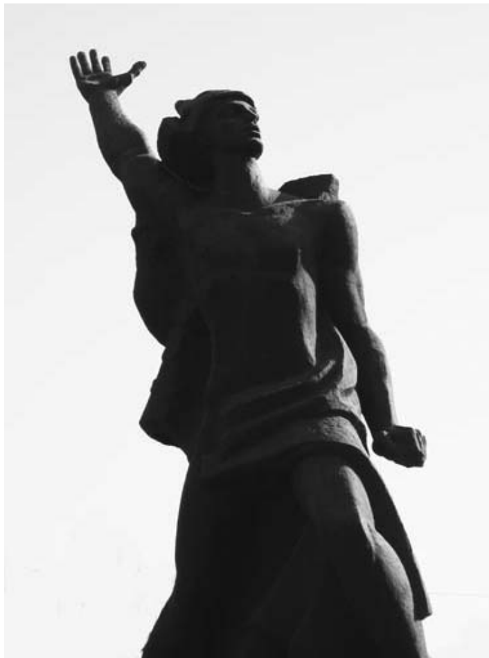
Памятник 50-летию ВЛКСМ, 1968