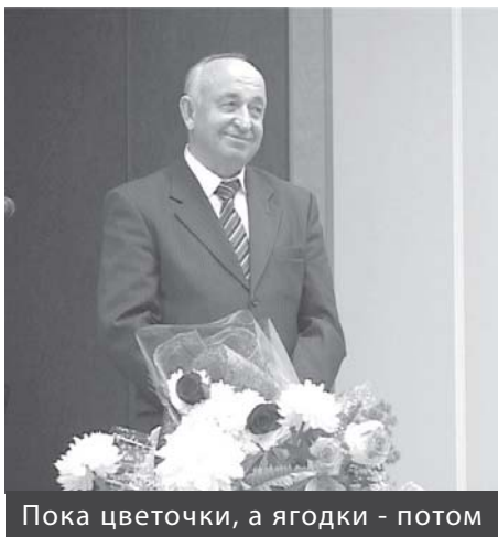
Пока цветочки, а ягодки - потом