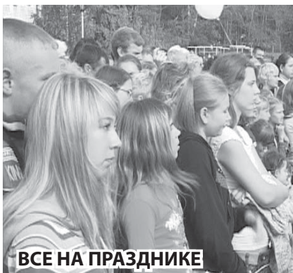
ВСЕ НА ПРАЗДНИКЕ

Второго августа нашему орденоносному городу исполнилось 230 лет. В этот же день коллектив градообразующего предприятия отметил 75-летие ВСМПО.