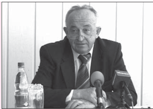
График проектных работ осуществляется за счет городского бюджета и за счет средств Уральских газовых сетей. Заявки на газификацию с. Никитино, дер. Северной и еще не газифи-

цированных домов В. Салды оформлены. Отрадно, что подведен газ в храм Иоанна Богослова. Необходимо испытать и опробовать систему газоснабжения по всем параметрам.