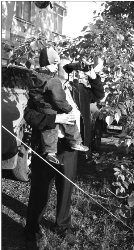
Стою у «Рубина», но вижу «Машину...»

Уже после семи часов вечера пространство пустыря возле техникума было заполнено людьми. В уютных кафе, разместившихся по периметру, вкусно пахло шашлыками. Свободных мест за столиками не было. Некоторым проголодавшимся даже пришлось отстаивать свои места при помощи повышенного тона. Но, слава Богу, все закончилось миром! Продавцы воздушных игрушек ловко приводили свой товар в должный вид и с улыбками продавали многочисленным покупателям. Изрядно подогретые спиртными напитками, салдинцы бурно общались, нетерпеливо поглядывая на сцену. И вот этот миг настал! Как-то незаметно весь состав группы появил-