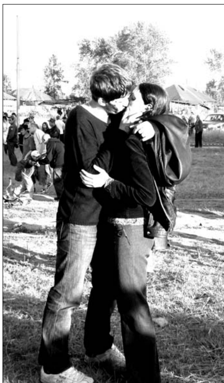
Любовь важнее музыки

Уже после семи часов вечера пространство пустыря возле техникума было заполнено людьми. В уютных кафе, разместившихся по периметру, вкусно пахло шашлыками. Свободных мест за столиками не было. Некоторым проголодавшимся даже пришлось отстаивать свои места при помощи повышенного тона. Но, слава Богу, все закончилось миром! Продавцы воздушных игрушек ловко приводили свой товар в должный вид и с улыбками продавали многочисленным покупателям. Изрядно подогретые спиртными напитками, салдинцы бурно общались, нетерпеливо поглядывая на сцену. И вот этот миг настал! Как-то незаметно весь состав группы появил-