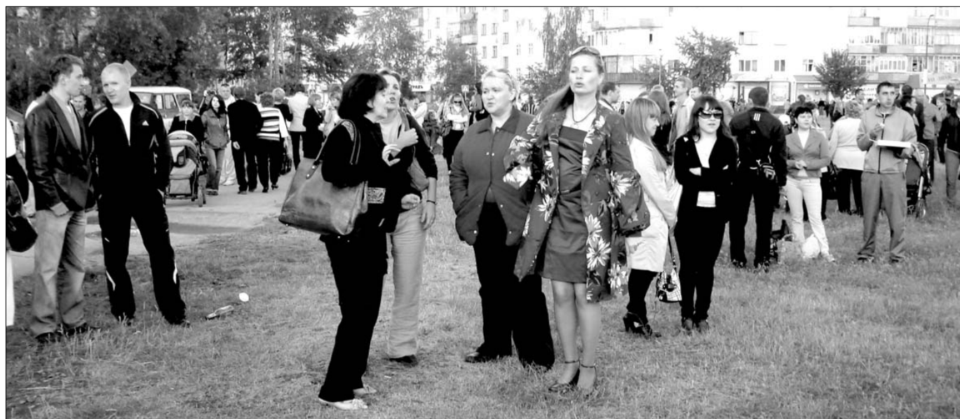
Дискотека под открытым небом

Ставшая впоследствии флагманом отечественной рок-музыки группа «Машина времени» образовалась в одной из московских школ, когда Андрей Макаревич под влиянием «Битлов» собрал ансамбль The Kids, просуществовавший недолго, но, обзаведясь тем не менее, довольно обширным репертуаром. К 1975 году состав более-менее стабилизировался, как и узнаваемая стилистика группы, представляющая собой разношерстные интересы музыкантов – бардовская песня, блюз, рок-н-ролл и кантри с ироничной лирикой Макаревича. Все это способствовало быстрому росту популярности группы среди молодежи. В 1978 выходит дебют «День Рождения». Маргулис покидает «Машину времени» ради «Воскресенья», а Макаревич с обновленным составом продолжает дивную историю «Машиноманию». С 1986 года с изменением культурной политики страны группа вздохнула свободно и радуется поклонников до сих пор.