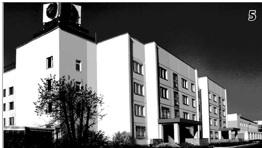
на какой улице расположено это здание?