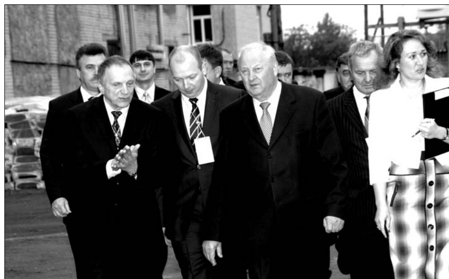
Владислав Тетюхин, Михаил Воеводин и Эдуард Россель во время визита на предприятие «Урал Боинг Мануфактуринг»