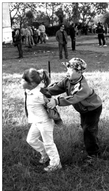
- Мы, как маленькие «Машинки времени», всегда в движении.