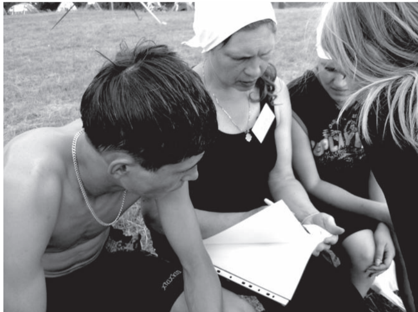
Басьяновцы готовятся к очередному конкурсу