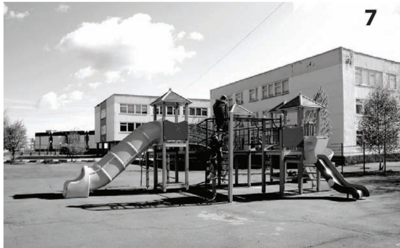
Назовите номер школы?