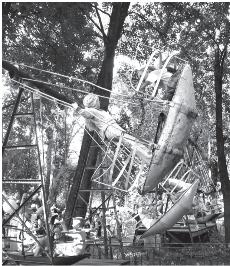
«Крылатые качели» - отзвук детства