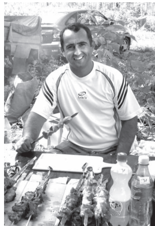
Шашлыков, очень вкусных, хватило всем