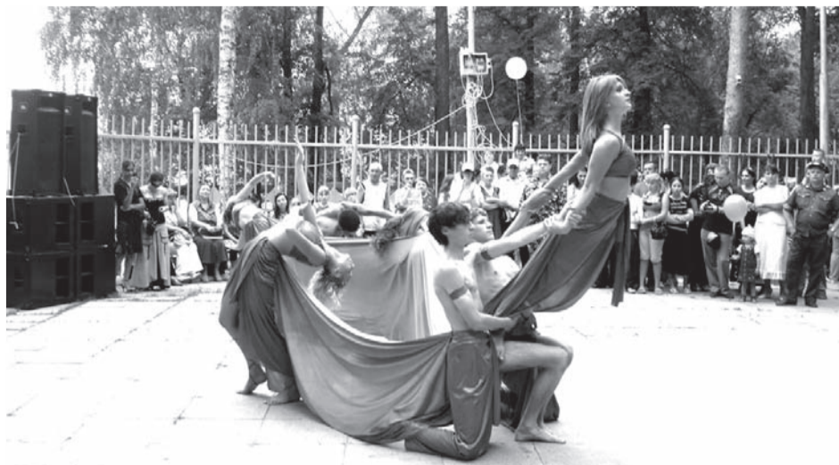
Гости из Ирбита: шоу-балет «Рандеву»