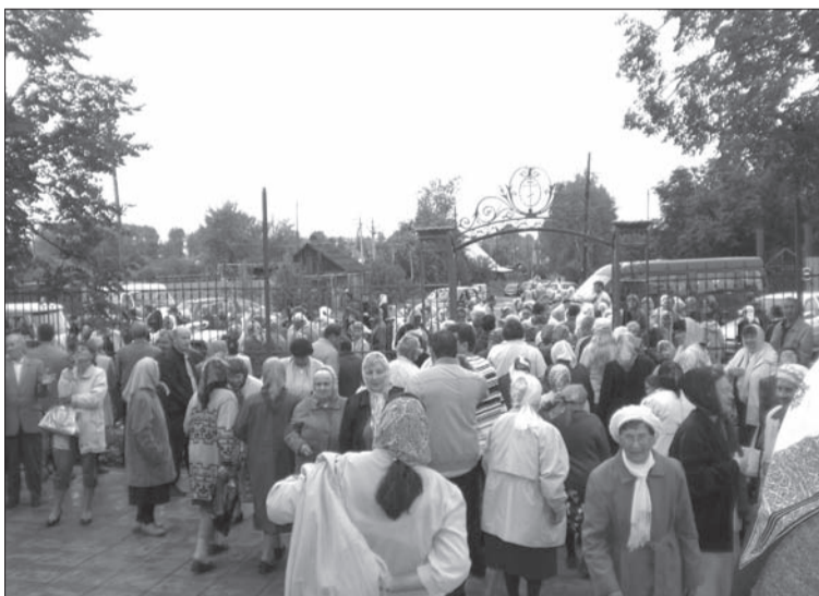
ПЕРЕД ХРАМОМ ИОАННА БОГОСЛОВА 25 ИЮЛЯ 2009 ГОДА.