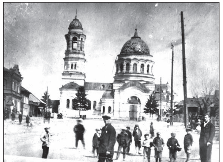
ХРАМ ИОАННА БОГОСЛОВА, 1936 ГОД.