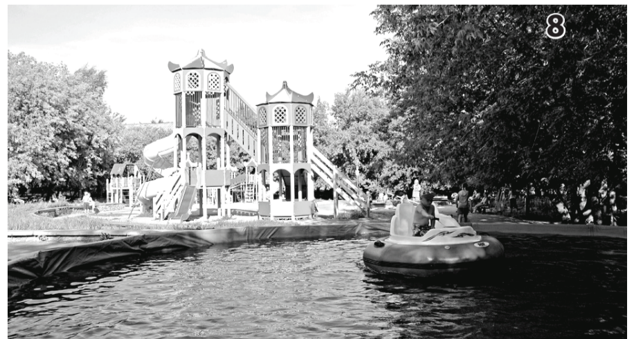
Где в Салде это место?