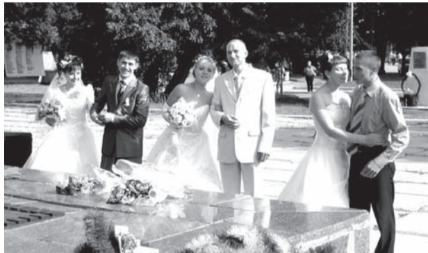
Создать семью в день города - это традиция молодых невянцев