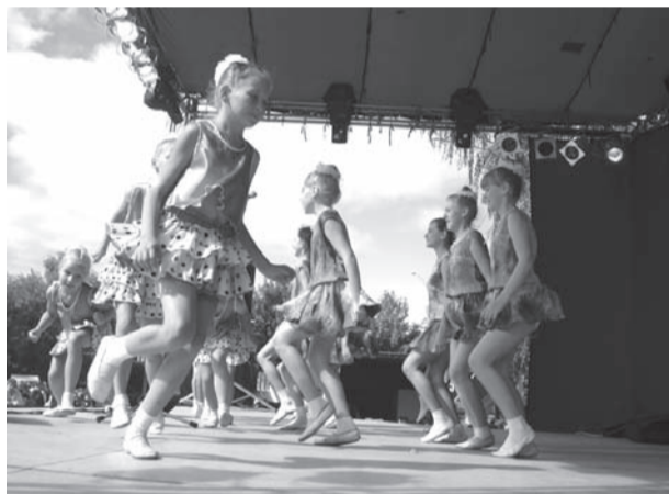
Очаровательные девчонки из коллектива «Забийки»