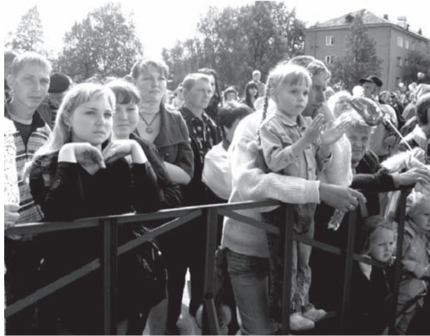
НЕ ОТРЫВАЯ ГЛАЗ ОТ СЦЕНЫ

Два дня, 31 июля и 1 августа 2009 года, праздновали невянцы День рождения города. Спортивные мероприятия, развлекательные программы - «Чудеса Невьянска» и «Радуга лета», ярмарка «Разноцветье талантов» - это лишь маленькая толика того, что происходило в городе в эти дни.