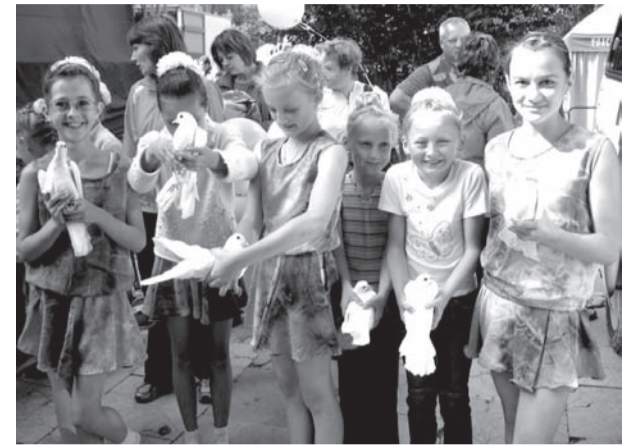
За несколько минут до «голубиной феерии»