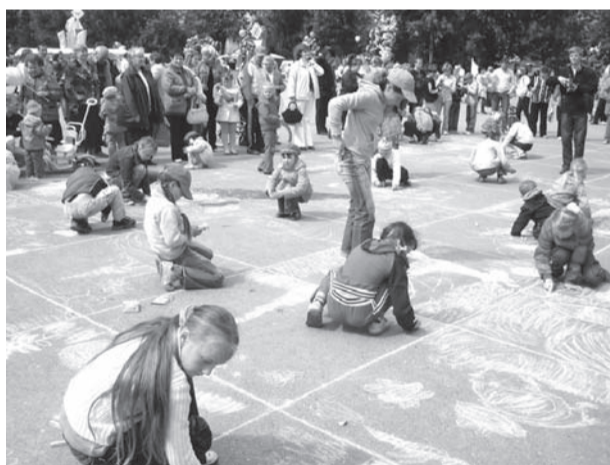
В РИСУНКАХ ЮНЫХ НЕВЬЯНЦЕВ ИХ ГОРОД САМЫЙ КРАСИВЫЙ