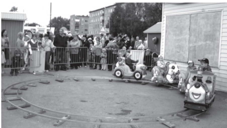
Наш паровоз вперед лети - салдинских деток прокати!