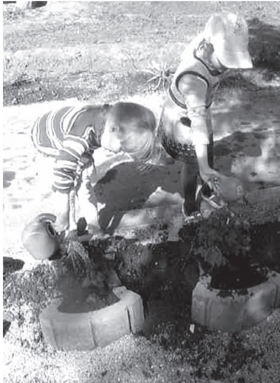
С первого дня появления на свет ребенок становится первооткрывателем, исследователем мира, окружающего

его. Для него всё впервые: солнце, дождь, вода, воздух, камень, песок, страх, радость. Познавательная активность дошкольников высока, любопытство рождает множество вопросов, на которые предстоит ответить взрослым.