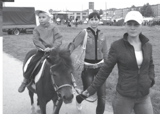
Покататься на пони - мечта любого ребенка!