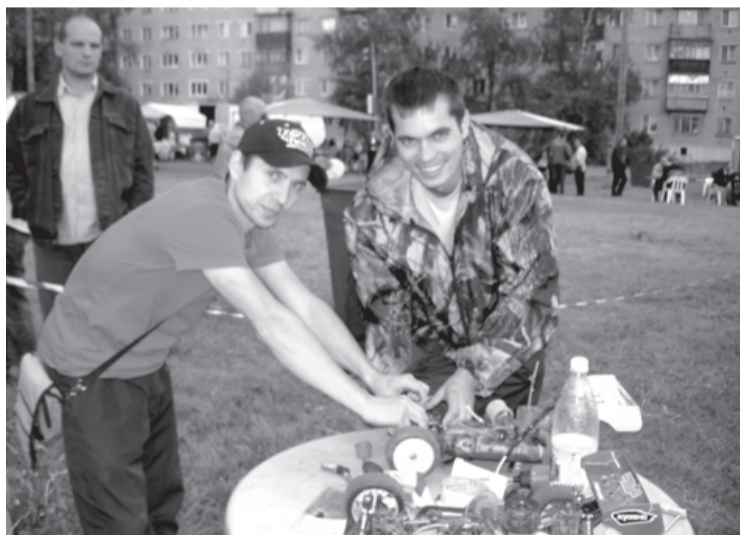
Подготовка к показательным выступлениям радиоуправляемых моделей