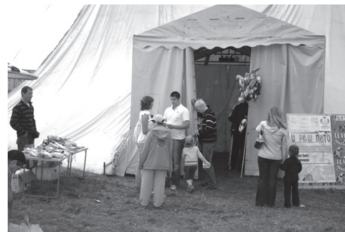
В цирке «ШАПИТО» аншлага нет, билеты дорогие и не всем салдинцам по карману