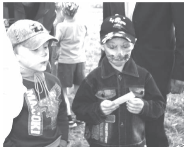
Боди-ард для мальчиков!