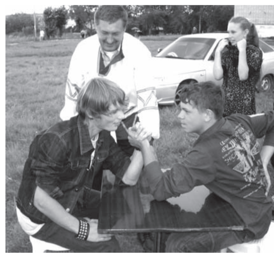
КТО КОГО? Конкурс для настоящих мужчин