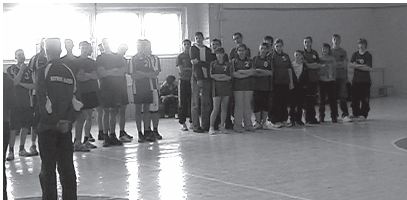
ПАРАД УЧАСТНИКОВ СОРЕВНОВАНИЙ