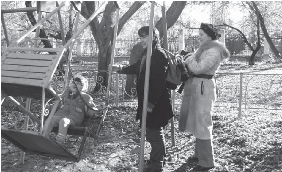
Прогулки на салдинской земле