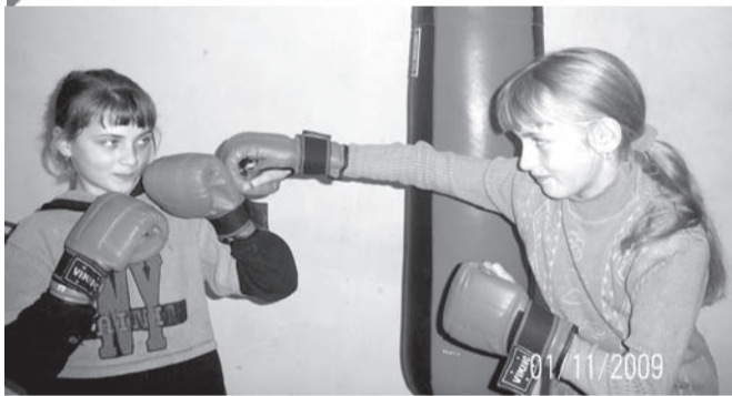
Стар и млад у нас при деле! Заходи! - Найдешь себя! Клуб для всех семь дней в неделю Открывается любя!