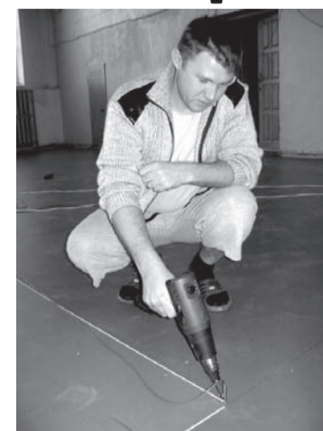
Уже через неделю на этом полу в техникуме будут играть