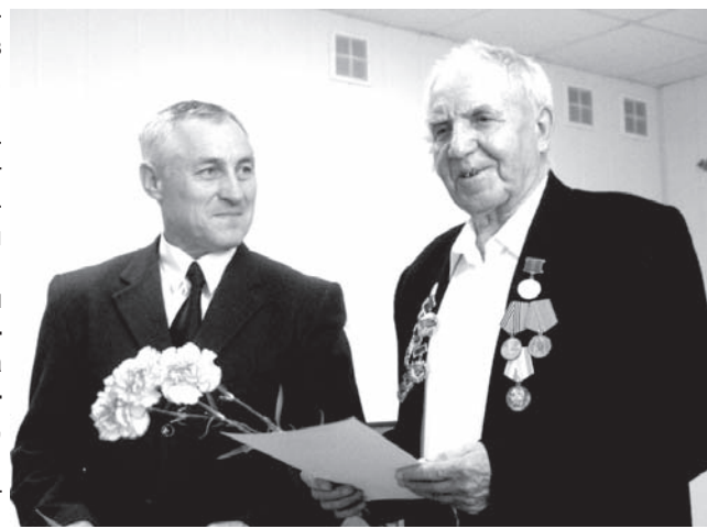
Вручение благодарственного письма

Гептил – токсичное вещество первого класса опасности. Знающие люди утверждают, что оно в шесть раз токсичнее синильной кислоты. При падении ступеней стратегических ракет гептил разлагается в окружающей среде, однако не так быстро, как хотелось бы. Исследования за-