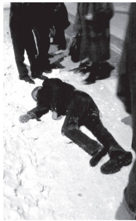
«Телефон доверия» ОВД по Верхнесалдинскому городскому округу (34345) 5-01-13. «Телефон доверия» ГИБДД - 5-01-14

Обзор преступлений и происшествий подготовлен по сводке, предоставленной редакции штабом Верхнесалдинского ОВД.