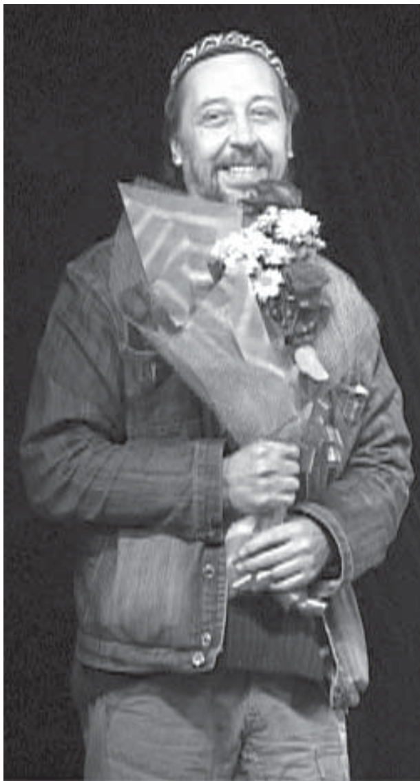
Николай Коляда восхищен игрой салдинских актёров

20 ноября в ДК имени Агаркова состоялась премьера спектакля «Корабль дураков, или Нелюдимо наше море...». По личному определению автора, российского драматурга Николая Коляды, это трагикомическая притча в двух действиях. Сам Николай Алексеевич специально приехал на премьеру из Екатеринбурга, и весь спектакль находился в зале, аплодируя и сопереживая своим персонажам. Пьеса была написана в 1986 году и с тех пор выдержала множество постановок на столичных и провинциальных сценах.