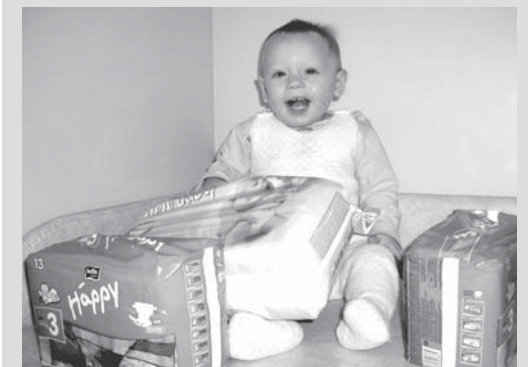
Малыш получил подарки от ООО «Орбита-Сервис»

Спасибо жителям города, откликнувшимся на детскую беду. Дети очень рады подаркам.